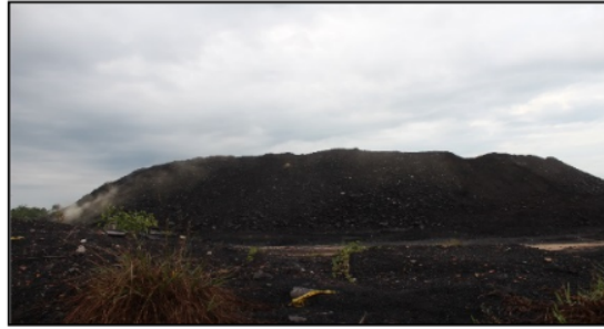
Gambar 3. Tumpukan Akhir Temporary Stockpile Pit 1B Tampak Belakang.