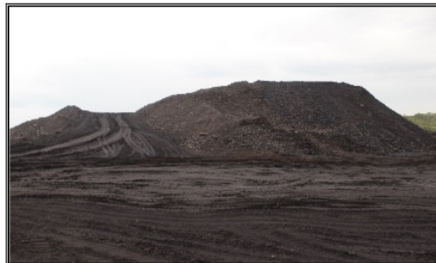
Gambar 2. Tumpukan Akhir Temporary Stockpile Pit 1B Tampak Depan .