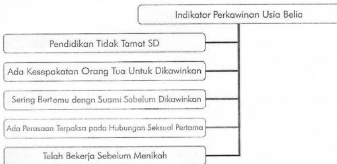
Bagan 2. Indikator Perkawinan Usia Belia

Berdasarkan proporsi umur ketika kawin dalam rentang 13-15 tahun, 16 – 17 tahun, dan 18 – 19 tahun, maka diuraikan pada Tabel 4 berikut ini: