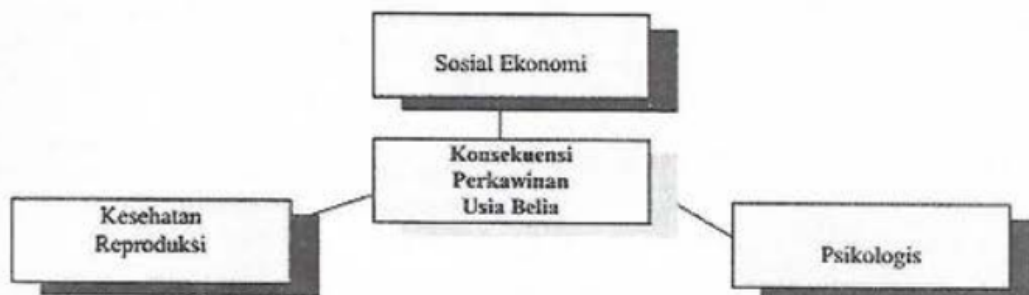
Bagan 3 Konsekuensi Perkawinan Usia Belia

Sebelum memasuki jenjang kehidupan berumah tangga, terdapat beberapa responden yang pernah bekerja sesuai dengan tingkat pendidikan mereka yang umumnya rendah, maka jenis pekerjaan yang dilakukan adalah jenis-jenis pekerjaan yang relatif tidak memerlukan prasyarat pendidikan dan keterampilan khusus. Dari responden, terdapat 30 (60 %) orang diantaranya mempunyai status pekerja yang berupah, jenis pekerjaan sebagai buruh tani sebesar 21 (42 %) orang, pedagang dan pengrajin masing-masing 4 (13 %) sedang pada buruh industri 1 (3 %) orang.