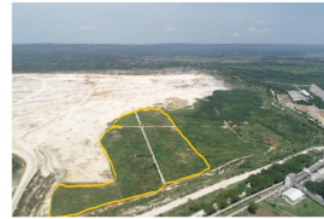
Gambar 3. Realisasi penutupan tajuk di blok E, F dan G pada tahun 2019

Dari hasil pengamatan yang dilakukan dengan pengamatan gambar citra udara untuk menemukan seberapa besar persentase penutupan tajuk terhadap keseluruhan luas area reklamasi pada tahun 2019. Setelah dilakukan pengamatan maka didapat belum terjadinya penutupan tajuk sehingga tutupannya belum terpenuhi karena umur revegetasi baru kurang lebih 5 bulan. Gambar 3 menunjukkan realisasi luas area penutupan tajuk di blok E, F dan G pada tahun 2019.