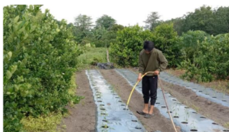
Gambar 3. Petani menyiram tanaman di lahan di Desa Tanjung Baru Kecamatan Indralaya Utara

Berdasarkan hasil wawancara didapatkan hasil bahwa hampir semua petani sudah menggunakan pestisida mulai dari insektisida, fungisida dan herbisida, dengan dosis dan frekuensi yang berbeda-beda. Setiap petani melakukan penyemprotan di waktu pagi dan sore hari. Waktu penyemprotan sangat penting diketahui oleh petani dalam pemakaian pestisida. Pestisida yang digunakan oleh petani dilakukan pendampingan dalam penyemprotan. Sehingga pestisida yang digunakan tepat sasaran. Selain itu, juga dilakukan pendampingan terhadap budidaya cabai mengenai cara penyiraman tanaman yang masih kecil (Gambar 3).