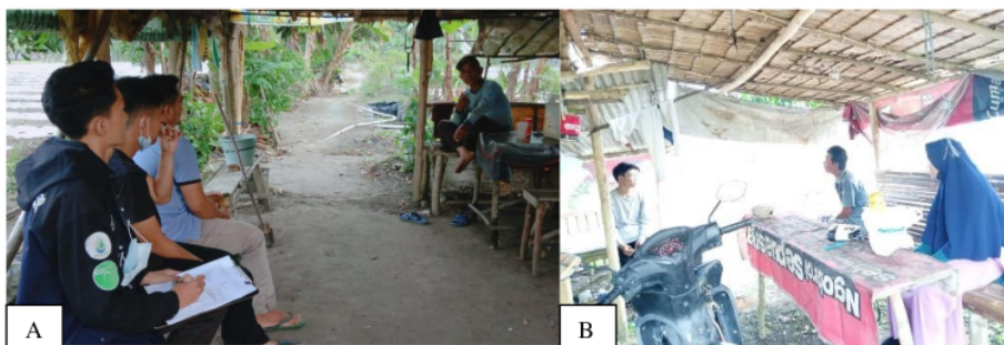
Gambar 6. Pendataan petani dalam penggunaan pestisida yang tepat sasaran (a), sosialisasi pada petani mengenai tepat sasaran dalam penyemprotan pestisida (b).

angin. Wawancara yang dilakukan dengan cara lahan ke lahan milik petani. Wawancara dilakukan untuk mengali informasi kepada petani mengenai pestisida yang digunakan dalam mengendalikan hama dan penyakit di lapangan. Selain itu, dilakukan penjelasan mengenai pestisida sintetik agar sesuai dosis yang diaplikasikan dan tepat sasaran. Penggunaan pestisida masing-masing petani berbeda, hal ini tergantung keperluan petani dalam mengendalikan organisme pengganggu tanaman di lapangan. Penjelasan mengenai peralatan dalam melakukan penyemprotan seperti, masker, baju Panjang, sarung tangan, sepatu boot dan poncho. Alat-alat tersebut digunakan untuk melindungi tubuh dari pestisida yang disemprotkan. Peralatan pelindung yang digunakan masih tergolong rendah. Hal ini dikarenakan masih kurang pengetahuan petani dampak pestisida yang digunakan apabila mengenai tubuh (Gambar 6).