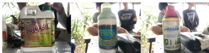
Gambar 2. Beberapa pestisida yang digunakan oleh petani di Desa Tanjung Baru

Berdasarkan hasil wawancara didapatkan hasil bahwa hampir semua petani sudah menggunakan pestisida mulai dari insektisida, fungisida dan herbisida, dengan dosis dan frekuensi yang berbeda-beda. Setiap petani melakukan penyemprotan di waktu pagi dan sore hari. Waktu penyemprotan sangat penting diketahui oleh petani dalam pemakaian pestisida. Pestisida yang digunakan oleh petani dilakukan pendampingan dalam penyemprotan. Sehingga pestisida yang digunakan tepat sasaran. Selain itu, juga dilakukan pendampingan terhadap budidaya cabai mengenai cara penyiraman tanaman yang masih kecil (Gambar 3).