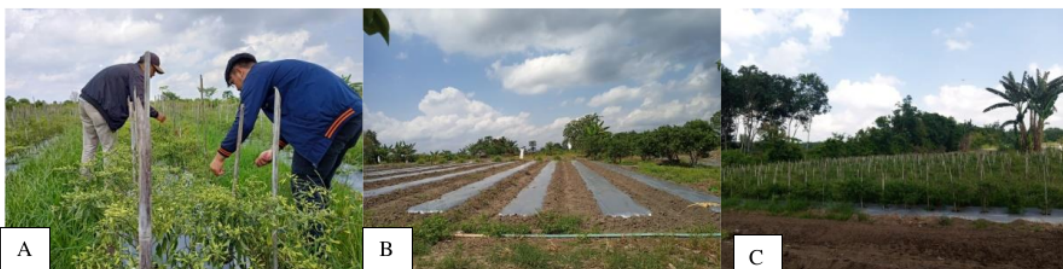
Gambar 1. Pembersihan gulma di sekitar pertanaman cabai (A), Guludan yang sudah diberi mulsa (B), Lahan cabai petani di Desa Tanjung Baru (C)

Untuk menurunkan serangan hama dan penyakit tentunya petani berupaya dalam menguranginya yaitu dengan menggunakan bantuan pestisida. Penggunaan dosis pestisida pada setiap petani berbeda-beda, dalam beberapa kasus, beberapa petani ada yang dicampur ada pula tidak dicampur sama sekali. Dalam menggunakan pestisida tentunya petani menggunakan alat pelindung seperti masker, baju panjang, sarung tangan, sepatu boot, dan poncho/jas hujan. Sebagian besar petani di Desa Tanjung Baru sudah menggunakan alat pelindung, walaupun ada beberapa petani dalam penggunaan alat pelindung yang tidak lengkap digunakan seperti tidak menggunakan poncho/jas hujan, masker, sarung tangan. Penjelasan tentang dosis dan sasaran pestisida yang digunakan oleh petani. Hal ini, untuk memberikan informasi mengenai pestisida yang digunakan petani (Gambar 2).