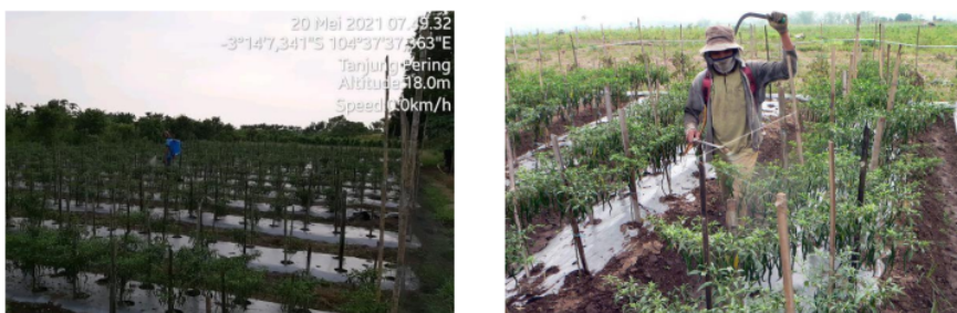
Gambar 4. Petani menyemprot di lahan cabai menggunakan alat pelindung seperti masker, sarung tangan, baju lengan panjang dan sepatu boot.