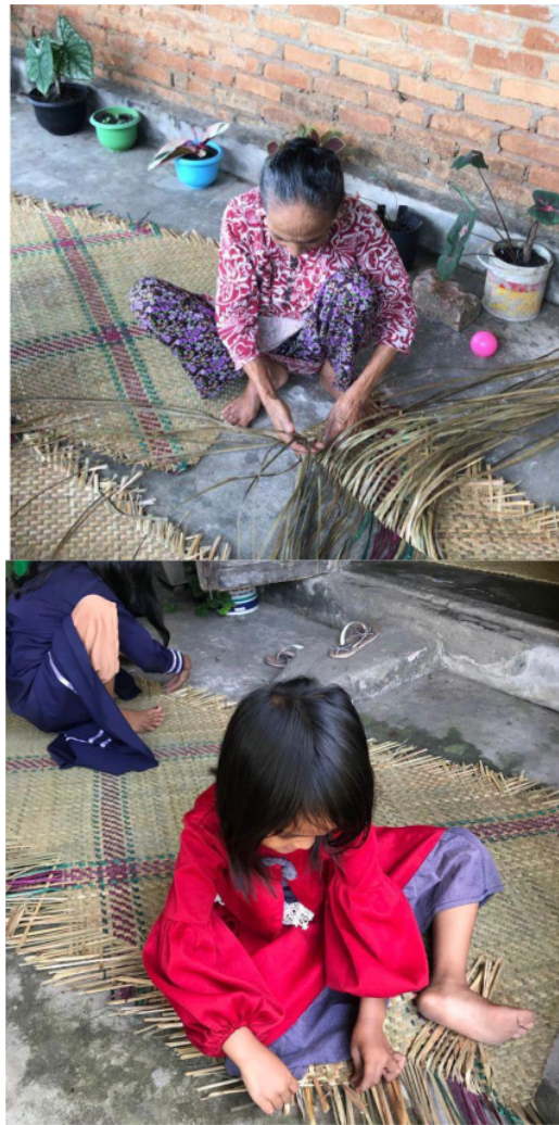
Gambar 3. Ibu dan Anak yang tetap menganyam purun di masa pandemi COVID-19 di Desa Menang Raya