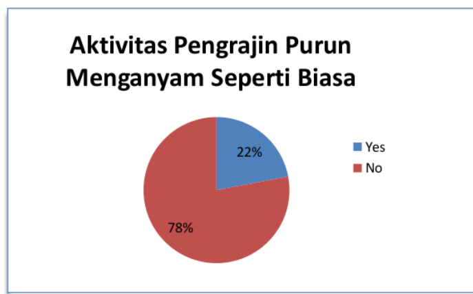
Gambar 1. Diagram aktivitas pengrajin Purun

Namun berdasarkan penelusuran peneliti, dapat dikatakan bahwa saat ini masyarakat khususnya perempuan pengrajin purun melaporkan penurunan pendapatan akibat pandemi COVID-19. Masyarakat juga mengkhawatirkan akan penurunan minat dan jual beli hasil kerajinan purun mereka. Ditemukan juga bahwa ada sebagian dari masyarakat bahwa perempuan menjadi pencari nafkah utama dalam rumah tangga. Memang mayoritas pekerjaan masyarakat di Kabupaten OKI adalah sebagai petani dan berkebun dimana menganyam purun hanya sebagai pekerjaan waktu senggang.