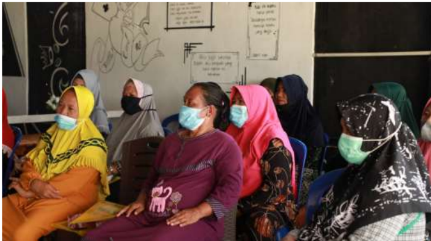
Gambar 2. Khalayak sasaran kegiatan pengabdian

Perencanaan keuangan merupakan proses untuk mencapai tujuan hidup seseorang atau keluarga melalui manajemen keuangan yang tepat dan terencana (FPSB, 2013b). Personal finance dalam manajemen keuangan merupakan suatu kegiatan yang berkelanjutan, terkoordinasi dan terintegrasi (FPSB, 2013a). Kegiatan untuk mengimplementasikan secara total dan terkoordinasi tertuang dalam perencanaan keuangan ( financial planning ). Perencanaan keuangan mencerminkan cara seseorang dalam mengelola keuangan yang dampak positif untuk mencapai tujuan keuangan di masa mendatang (Yuliani et al., 2020). Tujuan keuangan seseorang termasuk membeli rumah, menabung untuk pendidikan anak atau untuk perencanaan pensiun.