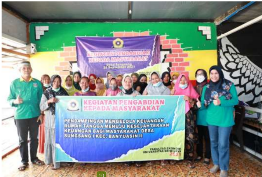
Gambar 4. Foto bersama peserta pengabdian