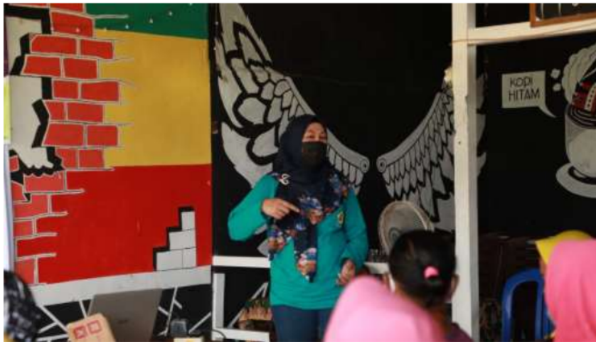
Gambar 3. Pemberian Materi Kegiatan

Hal paling penting dalam mengelola keuangan rumah tangga adalah komunikasi. Faktor komunikasi akan memutuskan sepakat bersama pasangan sehingga merencanakan keuangan bersifat transparan. Sepakat antara suami dan istri tentang mengelola keuangan rumah tangga akan memudahkan dalam menentukan tujuan keuangan.