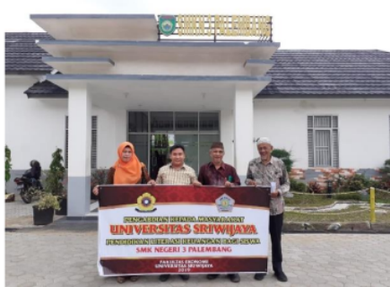
Gambar 5. Narasumber Kegiatan Pengabdian