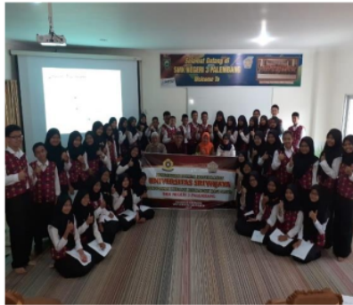
Gambar 4. Foto Bersama Acara Penutupan