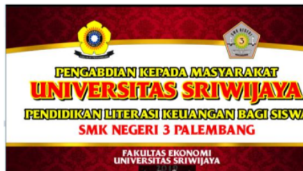
Gambar 6. Banner Kegiatan Pengabdian