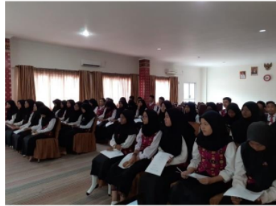
Gambar 3. Suasana Peserta Kegiatan

memahami literasi keuangan adalah 90%. Salah satu penyerapan materi berhasil karena peserta kegiatan adalah siswa SMK dimana cukup familier dengan keuangan, neraca, arus kas dan istilah-istilah keuangan. Peserta adalah siswa jurusan Akuntansi yang memang menjadi salah satu materi dengan keuangan dan laporan keuangan. Berikut foto seluruh peserta kegiatan: