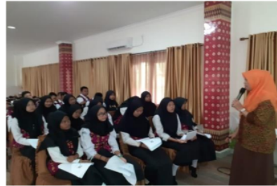
Gambar 2. Suasana Pemberian Materi Kegiatan

Contoh sederhana jika siswa saat ini menabung 100 ribu rupiah secara terus menerus selama lima tahun jika bunga di bank berlaku 5% pertahun maka dalam satu tahun jumlah uang akan menjadi sebesar 105 ribu rupiah jika sampai dengan lima tahun maka akan menjadi 125 ribu rupiah. Hasil perhitungan ini menggunakan konsep simple interest atau disebut dengan perhitungan bunga sederhana. Namun jika menggunakan konsep perhitungan bunga majemuk ( compound interest ) atau bunga berbunga maka jumlah tabungan selama lima tahun sebesar 127,63 ribu rupiah. Bunga dengan metode majemuk akan bergerak lebih eksponensial. Artinya dua konsep metode perhitungan bunga simple interest pertumbuhan bunga bersifat linear sedangkan compound interest pertumbuhan bunga bersifat geometric . Berikut foto kegiatan pemberian materi: