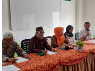
Gambar 1. Acara Pembukaan Kegiatan Pengabdian

Sesi ketiga adalah diskusi sebanyak enam pertanyaan dari siswa terkait dengan pendidikan literasi keuangan. Peserta lebih banyak bertanya tentang menabung dan investasi ada dua pertanyaan terkait dengan asuransi. Untuk memotivasi agar peserta antusias belajar dan memberikan pertanyaan maka diberikan hadiah. Hadiah berupa alat tulis sehingga akan menambah peralatan sekolah peserta. Berikut foto narasumber kegiatan pengabdian di SMK Negeri 3 Palembang: