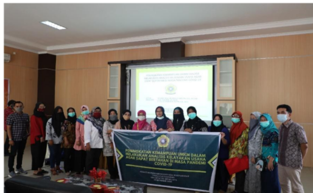
Gambar 3. Foto Bersama Peserta Pelatihan

Studi kelayakan adalah langkah yang dibutuhkan untuk memutuskan apakah kegiatan usaha dapat dilaksanakan atau dibatalkan. Dengan peningkatan kemampuan UMKM dalam melakukan kelayakan usaha merupakan salah satu cara untuk meningkatkan rencana pengembangan sebagai indikasi seberapa besar usaha yang dijalankan diharapkan lebih siap dan terencana apabila menghadapi situasi krisis. Analisis kelayakan usaha dipandang penting dilakukan, apalagi dikondisi yang tidak menentu saat pandemi sekarang ini. Keputusan dalam melakukan strategi kedepannya harus dinilai dulu layak atau tidak untuk dilakukan. Hal ini untuk menilai potensi peluang bertahan maupun daya saing UMKM ditengah masa pandemi.