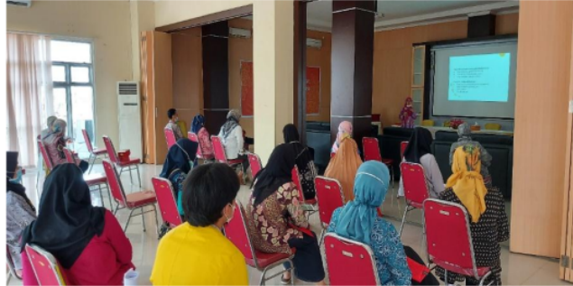
Gambar 2. Sesi Diskusi

pengabdian kepada masyarakat berupa pelatihan ini dilakukan dengan menerapkan protokol kesehatan sesuai dengan anjuran pemerintah yaitu penggunaan masker yang telah dibagikan, pengecekan suhu tubuh sebelum memasuki ruangan, menjaga jarak antar tempat duduk selama berlangsungnya kegiatan serta tersedianya handsinitizer di tempat yang mudah dijangkau peserta.