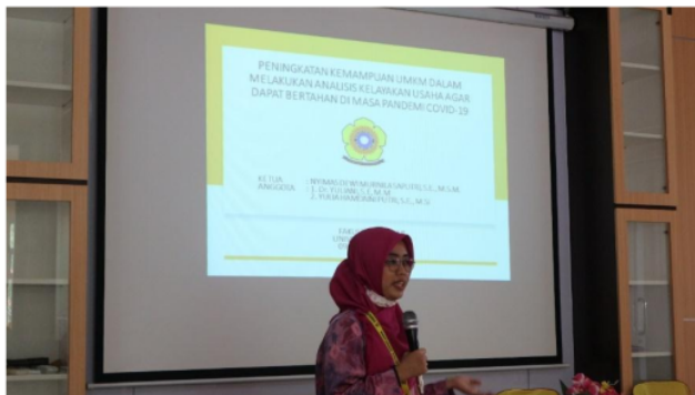
Gambar 1. Sesi Pelatihan dari narasumber

Kegiatan pengabdian kepada masyarakat yang berjudul “Peningkatan Kemampuan UMKM dalam Melakukan Analisis Kelayakan Usaha agar dapat Bertahan di Masa Pandemi COVID-19” telah dilaksanakan pada hari senin tanggal 09 November 2020 di Kantor Kecamatan Ilir Barat II Kota Palembang. Kegiatan pelatihan ini telah dihadiri oleh 30 peserta yang merupakan kelompok UMKM yang ada di Kota Palembang khususnya Kecamatan Ilir Barat II Kota Palembang dengan jenis usaha yang bergerak di bidang Songket, Suvenir, Kuliner, Penjahit dan Konveksi. Kegiatan