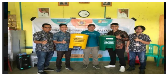
Gambar 4. Penyerahan secara simbolis kotak penampungan sampah oleh tim pengabdian kepada Kepala Desa Burai

Kegiatan ini dilakukan untuk memberikan pemahaman terhadap anggota tarang karuna dan masyarakat yang ada di desa burai untuk dapat lebih mengetahui pemanfaatan sampah. Sampah yang dahulunya dianggap tidak baik keberadaanya, kini bisa menghasilkan uang dengan adanya pembentukan bank sampah, serta dapat menciptakan lingkungan Desa Burai menjadi lebih bersih.