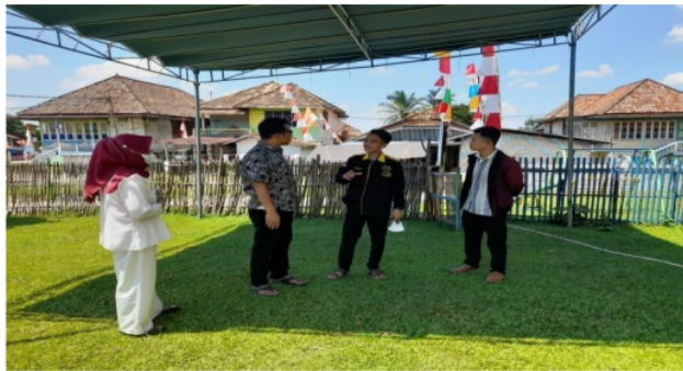
Gambar 1. Koordinasi tim pengabdian dengan perwakilan desa Burai

Dalam kegiatan ini tim pengabdian melakukan tinjauan langsung ke desa Burai sebelum kegiatan sosialisasi dan pendampingan dilaksanakan, tujuannya adalah untuk memastikan persiapan baik dari tim pengabdian maupun dengan peserta atau masyarakat yang menjadi target sasaran kegiatan ini.