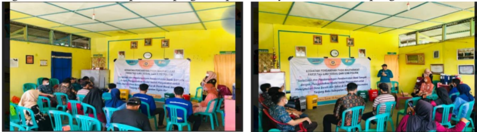
Gambar 2. Pembukaan Acara dan Kata Sambutan dari Kepala Desa Bura