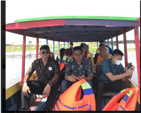
Gambar 5. Pemantauan di sekitar lingkungan desa pada lokasi rawa yang menjadi objek wisata di desa Burai.

Evaluasi kegiatan Sosialisasi dan Pendampingan Pembentukan Bank Sampah dengan Menggunakan Modal Sosial Masyarakat Untuk Menciptakan Desa Bersih dan Sehat di Desa Burai Kecamatan Tanjung Batu Kabupaten Ogan Ilir yang telah dilaksanakan dengan memantau lingkungan sekitar desa dan diskusi perkembangan adanya kegiatan tersebut.