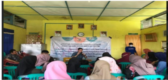
Gambar 3. Penyampaian Materi mengenai Bank Sampah

Materi yang disampaikan oleh para narasumber tersebut mengenai Stadium general tentang pengelolaan sampah, Tata Kelola Ekowisata dan Masalah sampah dan promosi kepariwisataan, dan : Kebijakan tentang pengelolaan sampah dan bank sampah.