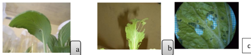
Gambar 1. Daun caisim yang sehat (a) dan daun yang dimakan oleh larva Plutella xylostella dengan perlakuan Bacillus thuringiensis Berliner (b dan c).

Pada saat awal aplikasi, daun yang digunakan segar dan sehat. Adanya pencelupan daun pada larutan yang mengandung spora dan protein B. thuringiensis , akan menyebabkan larva uji memakannya. Walaupun demikian, pada awal aplikasi larva uji tetap akan memakan daun untuk memenuhi kebutuhan hidupnya. Gejala kerusakan yang ditimbulkan oleh larva Plutella adalah hilangnya sebagian daun tanaman. Pada serangan yang berat, daun tanaman caisim hanya akan tersisa tulang daunnya (Gambar 1 b). Pada awal instar pertama pada umumnya larva akan memakan epidermis daun, namun dengan bertambahnya umur dan kebutuhan yang meningkat, menyebabkan larva memakan daun hingga menyisakan tulang daunnya.