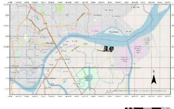
Gambar 1. Lokasi Studi pada Tepian Sungai Musi Perkampungan Plaju Ilir, Palembang

Kondisi seperti ini ditemukan pada permukiman padat di kota-kota di tepian sungai lainnya di Indonesia (Amri 2013). Tepian sungai merupakan salah satu area pertumbuhan permukiman kumuh. Infrastruktur Kota sulit direvitalisasi karena jalur akses perbaikan yang sempit dan kepadatan pertumbuhan penduduk yang cepat selalu menjadi masalah di setiap Kota. Pertumbuhan penduduk bergerak cepat, sedangkan revitalisasi infrastruktur kawasan bergerak lambat. Kesulitan ekonomi membuat warga menerima ketidaknyamanan lingkungannya.