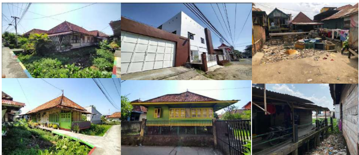
Gambar 3. Kondisi rumah dan lingkungan di Kampung Plaju Ilir: Rumah Tanpa Pagar (Kiri), Rumah dengan Pagar Pembatas (Tengah), Sampah pada Lingkungan

pada kawasan juga ditemukan rumah kontrakan dan kamar sewa. Pada tepian sungai terdapat pabrik pengolahan karet yang masih mengandalkan jalur transportasi sungai untuk keperluan pengiriman Bahan Baku dan hasil olahan. Pabrik dikelilingi dengan bangunan penunjang bagi fungsi pabrik, berupa Kantor, lapangan parkir dan rumah pegawainya. Area industri ini dikelilingi dengan pagar pembatas dengan rumah penduduk. Pabrik ini juga memiliki jalan masuk tersendiri dengan gerbang sehingga kegiatan pabrik terpisah dengan aktivitas