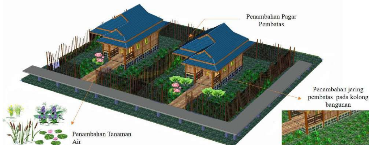
Gambar 4 Modifikasi Desain pada Rumah Panggung

Bangunan dengan jenis pondasi panggung pada area dekat sungai memiliki tumpukan sampah yang lebih banyak dibandingkan dengan bangunan berpondasi tapak. Pada rumah panggung tanpa pagar tersebut, aliran air menghanyutkan sampah. Pekarangan rumah ini dipenuhi oleh sampah yang berserakan. Sampah sampah di kolong dan pekarangan rumah tersebut bercampur dalam genangan air yang keruh. Kondisi bisa semakin parah saat air pasang, sampah dari luar permukiman hanyut masuk semakin dalam kawasan.