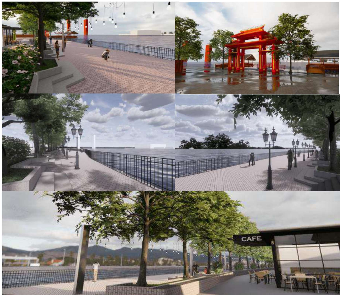
Gambar 2. Ilustrasi perbaikan Fasilitas di Ruang Terbuka Tepian Sungai