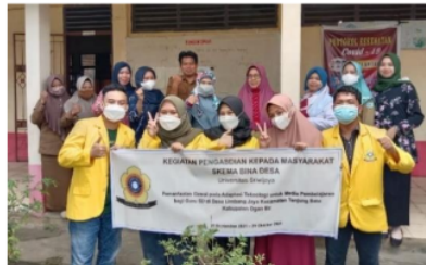
Gambar 5. Foto Bersama Setelah Kegiatan pada Pertemuan 4: Penutupan Kegiatan

Materi yang disampaikan pada pertemuan 1 diawali dengan pengenalan gawai sebagai pendukung proses pembelajaran, penggunaan WhatsApp , WhatsApp Group , WhatsApp Web , dan materi inti adalah penggunaan google form untuk membuat absensi kehadiran, membuat PR, dan soal-soal. Penjelasan materi google form diawali dengan memperkenalkan secara singkat tentang google form , lalu menjelaskan apa saja fitur dari google form yang dapat digunakan sebagai media yang mempermudah proses belajar mengajar selama daring. Selanjutnya dilakukan praktek menggunakan google form . Praktek pertama yaitu cara membuat absensi melalui google form , dan kemudian dilanjutkan dengan praktek membuat soal PR, tugas, atau ulangan dengan jenis tipe jawaban termasuk pilihan ganda dan cara menampilkan perhitungan score .