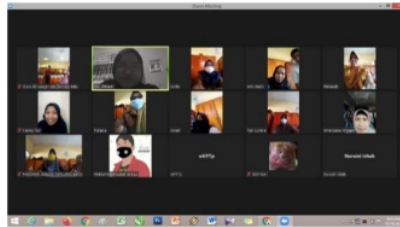
Gambar 4. Foto Bersama pada Pertemuan 3, Secara Offline dan Online