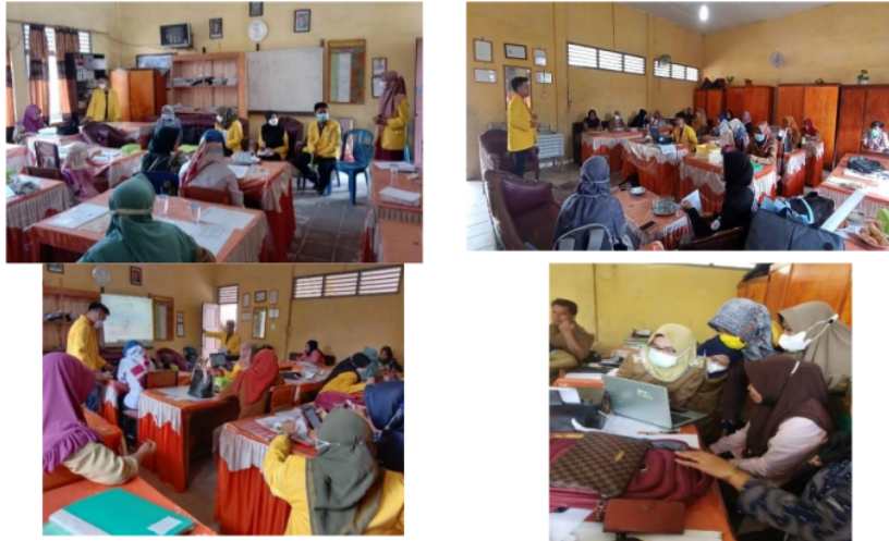
Gambar 1. Contoh Suasana Kegiatan pada Setiap Pertemuan: Penjelasan Materi dan Praktek

sebelum masa pandemi. Selain itu fasilitas mayoritas siswa untuk mengikuti pembelajaran secara daring masih cukup minim. Jika pembelajaran dengan tatap muka, respons (daya tangkap) siswa terhadap pelajaran lebih mudah diketahui. Lebih dari 80% mereka menyadari bahwa penggunaan gawai penting dalam proses pembelajaran. Ada 93% guru menjawab penting untuk meningkatkan kemampuan penggunaan teknologi gawai (HP, laptop, komputer, tablet) dalam mengajar. Hal ini menunjukkan antusias dan motivasi guru sangat tinggi untuk meningkatkan kemampuan mereka terhadap pemanfaatan gawai dalam proses pembelajaran. Para guru juga mayoritas berpendapat bahwa siswa SDN 9 dapat didorong menggunakan HP sebagai media untuk belajar, apalagi jika ada pendampingan dari orangtua dan guru.