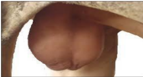
Gambar 2. Pengukuran panjang skrotum

Panjang skrotum menurut (Aurich & Achmann, 2002) diukur dari pangkal sampai ke bawah skrotum menggunakan meteran pada testis seperti gambar dibawah ini.