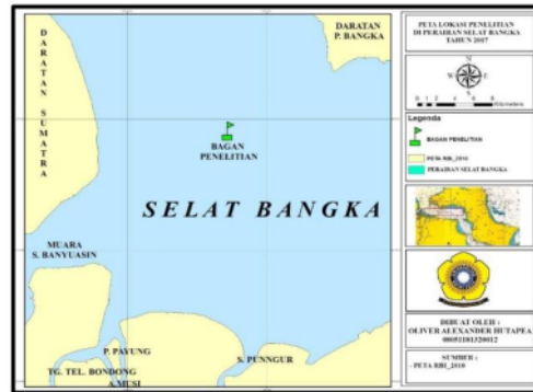
Gambar 1. Lokasi penelitian

Penelitian dilaksanakan pada bulan Agustus 2017 di perairan Selat Bangka. Pada Gambar 1 menunjukkan lokasi bagan yang terdapat di perairan Selat Bangka. CTD ( Conductivity Temperature Depth ) merupakan alat yang digunakan untuk mendeteksi berbagai jenis parameter antara lain suhu, salinitas, kedalaman, DO, Klorofil-a. Pengukuran parameter perairan menggunakan alat CTD ( Conductivity Temperature Depth ) dilakukan di Perairan Selat Bangka dengan titik koordinat S 02°14.548' E 105°02.983' di salah satu bagan nelayan tersebut dengan cara pengambilan data yang dilakukan secara mooring dengan (selisih waktu perdua jam).