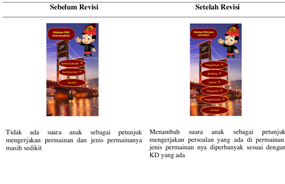
Tabel. 3 Hasil evaluasi diri.

Tahap ini menganalisa games pembelajaran yang telah dikembangkan, tujuan dari tahap ini adalah untuk merevisi produk. Evaluasi yang dilakukan meliputi proses desain pembelajaran, materi yang digunakan serta media teknologi yang dapat dikatakan layak untuk dapat dilanjutkan ketahap berikutnya. Hasil dari evaluasi diri yang ditunjukkan pada Tabel 3.