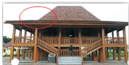
Gambar 2. Rumah Adat (Widyawati & Putri, 2016)

Menurut Zulkardi (2006) soal kontekstual matematika adalah soal matematika yang menggunakan berbagai konteks sehingga menghadirkan situasi yang pernah dialami secara real bagi anak. Konteks itu sendiri dapat diartikan sebagai situasi atau fenomena/kejadian alam yang terkait dengan konsep matematika yang sedang dipelajari. Menurut Wardhani & Rumiati (2011) berbagai budaya di Indonesia dan dunia juga perlu dipelajari, dengan menyertakan konteks budaya ini, wawasan siswa akan menjadi makin luas, dan kosa kata yang dimiliki juga makin kaya, sehingga siswa akan mudah menyelesaikan berbagai permasalahan yang dihadapi. Rumah Adat dapat kita jadikan sebuah konteks karena Rumah Adat memberikan konsep matematika di dalamnya yang dibangun sesuai dengan kearifan lokal masing-masing daerah. Selain itu juga kita bisa mengeksplorasi kearifan budaya lokal tersebut yang dipresentasikan dalam soal matematika dalam format TIMSS.