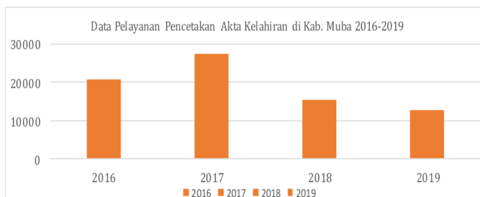
Grafik 1. Data Pelayanan Pencetakan Akta Kelahiran di Kabupaten Musi Banyuasin

Berikut disajikan pada Grafik 1. Data Pelayanan Khusus pencetakan akta kelahiran Dinas Kependudukan dan Pencatatan Sipil Kabupaten Musi Banyuasin dari tahun 2016-2019 dan tabel 2 yakni rekapitulasi kegiatan penerbitan akta kelahiran melalui Program Jemput Bola pada tahun 2019.