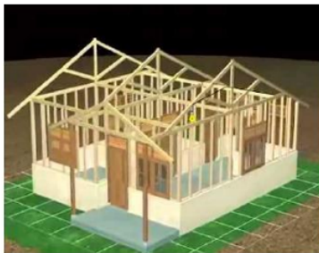
Gambar 1. Plafon Rumah

Revisi dari prototipe pertama disebut prototipe kedua. Berikut salah satu bagian yang telah direvisi dari prototipe pertama menjadi buku siswa prototipe kedua dapat dilihat pada gambar 3.