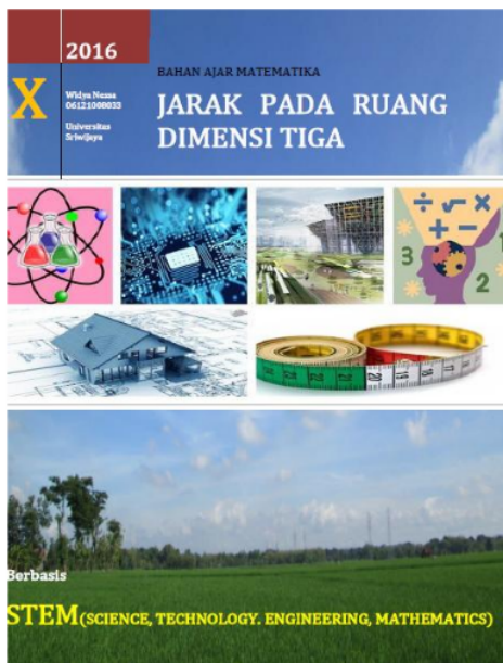
Gambar 1. Cuplikan Desain Awal Buku Siswa

Setelah melakukan langkah-langkah diatas maka didapatlah desain awal dari buku siswa dengan berbasis Science, Technology, Engineering, and Mathematics (STEM) Problem-based Learning pada materi jarak pada ruang dimensi tiga yang dibuat oleh peneliti. Desain awal dari buku siswa dapat dilihat pada gambar 1.