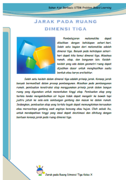
Gambar 2. Cuplikan prototipe pertama