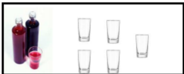
Gambar 1. Permasalahan LAS 1

pengetahuan kepada siswa paha bilangan pecahan murni yaitu bilangan yang berada antara nol sampai dengan bilangan satu. Berikut adalah masalah yang terdapat pada LAS 1.