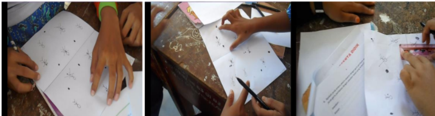
Gambar 1. Strategi siswa untuk berhasil membom pasukan lawan

Berdasarkan percakapan di atas dapat dilihat bahwa terdapat siswa yang bertanya bagaimana jarak antara peluru dengan garis batas dan pasukan lawan yang terbom dengan garis batas sehingga guru memberikan arahan pada percakapan berikutnya. Pada akhirnya siswa menemukan jawaban yang tepat.