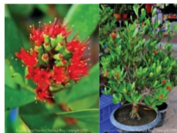
Gambar 5. Mangrove Lumnitzera littorea (Red Teruntum) sebagai tanaman hias di Thailand