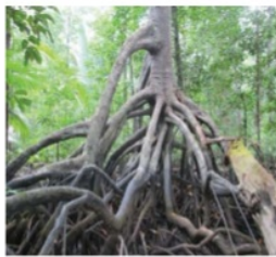
Gambar 1. Akar tunjang R. apiculata di hutan primer Taman Nasional Sembilang, Sumatera Selatan

Menurut Curran et al. (2006), beberapa jenis mangrove dapat dengan mudah ditanam dan tumbuh di dalam media hydroponic atau di dalam pot tanaman. Contoh jenis mangrovenya adalah: Aegiceras corniculatum , Bruguiera exaristata , B. gymnorrhiza dan Rhizophora stylosa . Jenis mangrove yang digunakan sebenarnya tergantung dari selera masing-masing. Beberapa yang pernah dicoba adalah jenis dari Rhizophoraceae . Mangrove memberikan gambaran tanaman yang secara habitus: unik dan eksotis—terutama penampilan propagul dan tipe akarnya, seperti perakaran Rhizophora apiculata (Gambar 1). Perakaran tersebut memberikan gambaran kondisi alami untuk tumbuhan yang sudah tua. Jika diberdayakan sebagai tanaman hias di dalam pot sangat unik dan menarik sehingga prospektif.