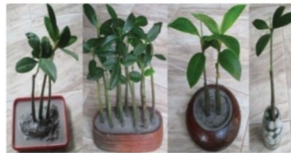
Gambar 3. Contoh mangrove yang ditanam dalam media air tawar

Gambar 3, merupakan contoh mangrove yang ditanam dengan media tanah terrestrial dan air tawar. Semuanya merupakan bibit yang berumur 3 bulan setelah tanam. Gambar pertama dan kedua adalah jenis R. apiculata dan gambar ketiga adalah B. gymnorrhiza . Gambar keempat adalah R. apiculata yang tumbuh hanya dengan air tawar saja tanpa adanya tanah, kelereng yang digunakan dimaksudkan agar tanaman dapat berdiri tegak.