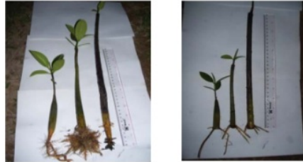
Gambar 2. Bibit berumur 10 minggu (dari kiri ke kanan berturut-turut adalah B. gymnorrhiza , R. apiculata dan R. mucronata ); (atas) tanpa pemotongan; (bawah) dengan pemotongan propagul)

dengan melakukan pemotongan propagul juga menarik. Propagul yang dipotong masih dapat tumbuh. Akar dapat keluar dari bekas potongan propagul (Gambar 2).