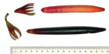
Gambar 6. Propagul Bruguiera gymnorhiza (Allen and Duke, 2006)

tidak memerlukan biaya yang tinggi. Bahan dapat dipilih dari bibit mangrove atau tanam langsung propagul (Gambar 6) ke media tumbuh atau pot. Media tumbuh dapat digunakan tanah, lumpur atau bahkan hanya air tawar saja dari sekitar tempat tinggal, tidak harus menggunakan media dimana mangrove tumbuh secara alami.