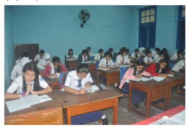
Gambar 5. Siswa mengerjakan soal pada field test

pengerjaan selama 2 jam pelajaran (90 menit) dengan soal tes sebanyak enam soal dimana setiap soal terdapat beberapa pertanyaan.