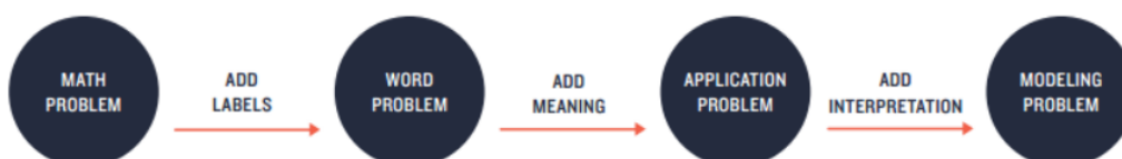
Gambar 1. Tahapan Soal Pemodelan Matematika

Dalam penelitian ini, kompetensi seorang calon guru dalam mengkonstruksi soal pemodelan matematika akan menjadi fokus penelitian. Hal ini penting dikaji untuk mendapatkan gambaran kompetensi mahasiswa dalam mendesain soal pemodelan matematika. Untuk mengkonstruksi soal pemodelan matematika, kita dapat menggunakan rujukan dalam buku GAIMME sebagai berikut: