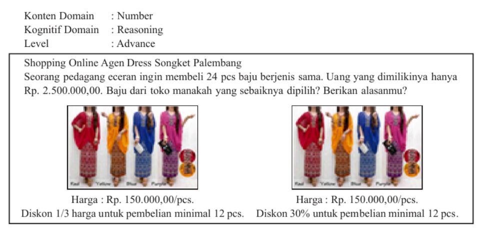
Gambar 1. Salah Satu Soal yang Diberikan kepada Siswa.

Berdasarkan analisis jawaban siswa terhadap 10 soal tipe TIMSS, dapat dilihat bahwa dalam menyelesaikan soal-soal tersebut sebagian siswa telah