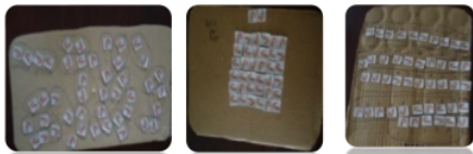
Gambar 1. Beberapa strategi siswa dalam mengelompokkan manipulatif uang

mengelompokkan siswa dapat menemukan beberapa strategi dalam mengelompokkan manipulatif uang, beberapa siswa menggunakan strategi menghitung satu-satu dan adapula yang menghitung sambil membilang meloncat dua, lima, enam dan sepuluh. Hal ini menuntun mereka menemukan jumlah manipulatif uang yang mereka hitung dan menuliskan dalam angka (gambar 1). Dalam diskusi kelas guru membimbing siswa menemukan bahwa pengelompokan sepuluh sebagai pengelompokan terbaik. Guru menekankan pula keterbatasan angka yang kita miliki membuat kita perlu mengkombinasikan angka-angka tersebut. Sebagai contoh angka satu bergandengan dengan satu disebut sebelas. Angka sebelas terdiri dari dua angka. Proses ini menuntun siswa untuk memahami bahwa pengelompokan sepuluh akan memunculkan suatu unit baru yang diberi nama kesepakatan yaitu puluhan.