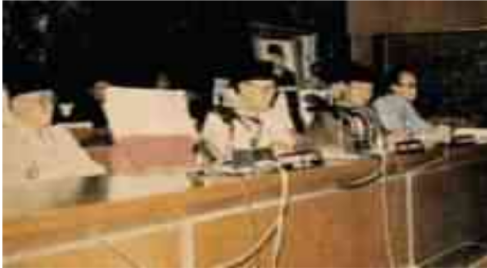
Gambar 24. Penutupan Sidang Paripurna Istimewa DPRD Sumatera Selatan oleh Ketua Periode sebelumnya, M. Umar RA sebelum diserahkan palu pimpinan kepada K.H. Yusuf Umar pimpinan sementara DPRD Sumatera Selatan Hasil Pemilu 1982.

Pada DPRD Provinsi Sumatera Selatan Periode 1982-1987, anggotanya sebagai Badan Pertimbangan Daerah (BPD) Provinsi Sumatera Selatan. Adapun yang duduk di BPD Provinsi Sumatera Selatan periode 1982-1987 ini adalah: