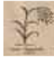
27 Partai Politik Tarikat Islam (PPTI)