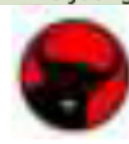
22 4 PDI Perjuangan