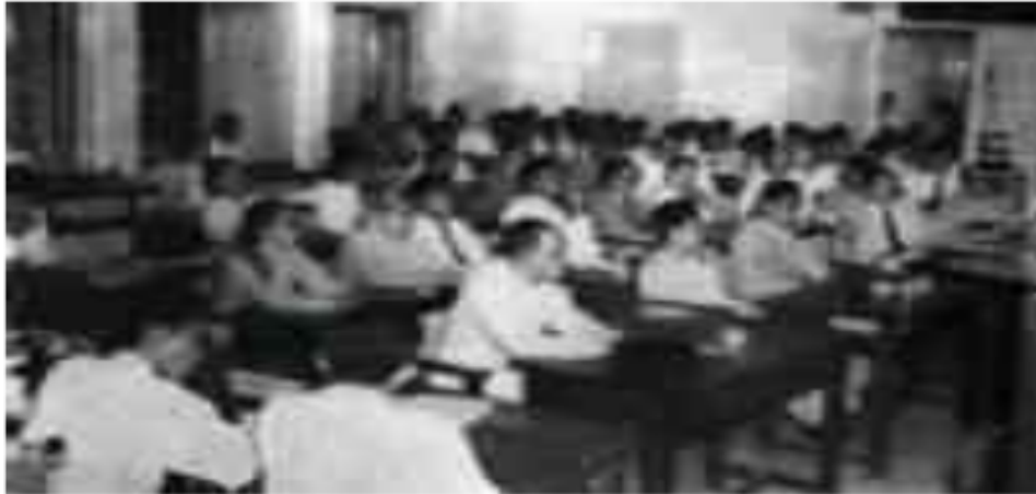
Gambar 11. DPRD-S 1950-1955 Mendengarkan uraian keadaan daerah dari Gubernur Sumatera Selatan dalam rapat pleno VI.

Pemerintah telah membeli onderneming dari tangan asing seperti onderneming Weskust, onderneming Sindang dan Dataran di Kabupaten Rejang Lebong. Para pejuang dipekerjakan dan membuat usaha di onderneming-onderneming tersebut kurang lebih sekitar 1.000 orang mantan pejuang, baik yang berasal dari Jawa maupun Sumatera Selatan.