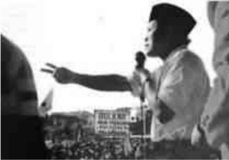
Gambar 31. Jurkam Golkar dalam Kampanye Pemilu 1987 di Lapangan Hatta Palembang

Pemungutan suara Pemilihan Umum untuk anggota legislatif dilakukan secara serentak pada tanggal 23 April 1987, termasuk di Sumatera Selatan. Pemilihan Umum 1987, tercatat sebagai pemilu keempat dalam rezim pemerintahan Orde Baru. Pemilu 1987 dilaksanakan dengan asas Langsung, Umum, Bebas, dan Rahasia (Luber).