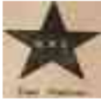
22 Persatuan Indonesia Raya (PIR)