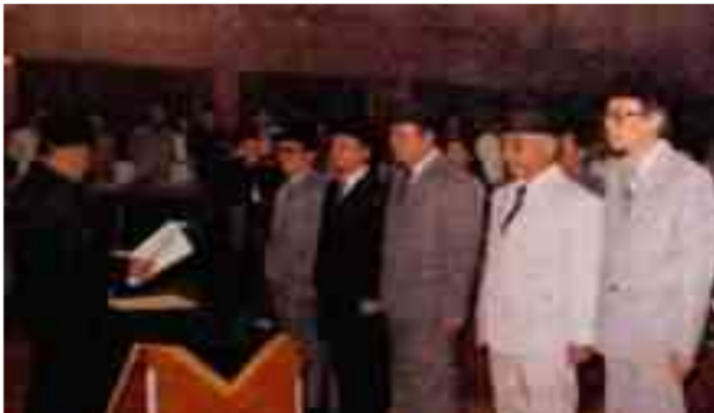
Gambar 26. Pengambilan Sumpah BPD oleh Gubernur H. Sainan Sagiman