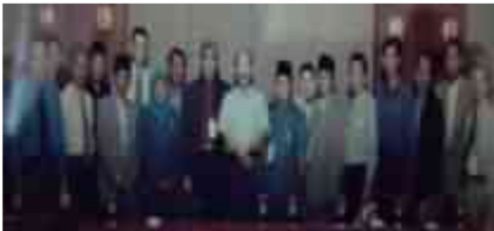
Gambar 37. Program Peningkatan Kompetensi Kelegislatifan Anggota DPRD Provinsi Sumatera Selatan 1999-2004

Ke-15 orang anggota DPRD Sumatera Selatan yang diberhentikan itu adalah para mantan kader PDI-P Provinsi Sumatera Selatan. Sebelumnya, mereka telah dikenai sanksi pemecatan dari keanggotaan partai oleh DPP PDI-P terkait dengan proses pemilihan Gubernur Sumatera Selatan tersebut. Dalam SK Mendagri itu disebutkan bahwa Mendagri meresmikan pemberhentian dengan hormat nama-nama yang tercantum dalam lampiran SK tersebut.