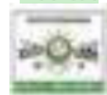
12 Partai Persatuan Nahdlatul Ummah Indonesia