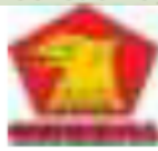
6 Partai Gerakan Indonesia Raya