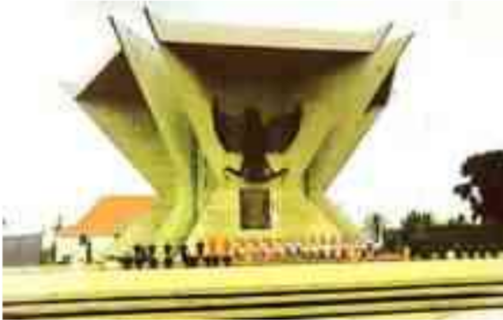
Gambar 32. Peresmian Pembangunan Monumen Perjuangan Rakyat (Monpera) tahun 1988 masa DPRD Sumatera Selatan Periode 1988-1993