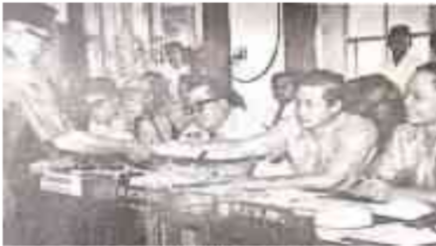
Gambar 20. Suasana Pemilihan Gubernur Sumsel 1973 di DPRD SS