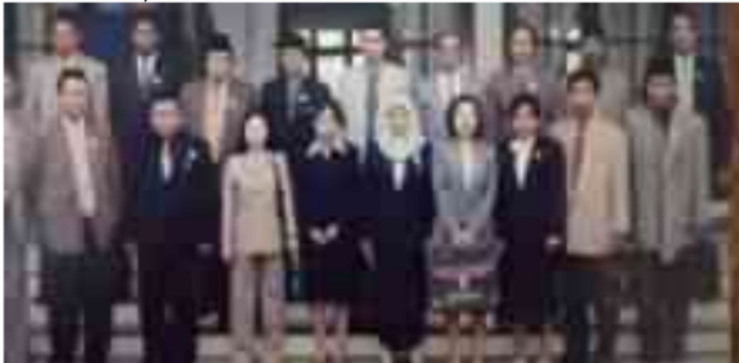
Gambar 36. Orientasi tugas dan fungsi DPRD Provinsi Sumatera Selatan Periode 1999-2004 di Jatinangor, Jawa Barat.

Sehingga komposisi anggota DPRD Sumatera Selatan 1999-2004 kembali berubah dan ditetapkan menjadi 75 orang berdasarkan Keputusan Menteri Dalam Negeri Nomor 161.26-973 Tanggal 6 September 1999, Keputusan Nomor 161.26-1019 Tanggal 16 September 1999 dan Keputusan Nomor 161.26-1175 Tanggal 14 Oktober 1999, terdiri dari: