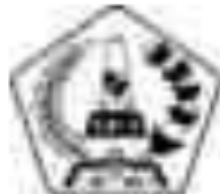
Gambar 17. Partai Politik Peserta Pemilihan Umum 1971

Berdasarkan Surat Keputusan Presiden Nomor 43 Tahun 1970 tanggal 23 Mei 1970 maka ditetapkan partai-partai peserta 14 Pemilihan Umum 1971 seperti yang ada pada gambar di atas. Partai-partai politik yang ikut dalam Pemilihan Umum 1971 tersebut sudah ada dan diakui serta mempunyai w 57 di DPR/DPRD sebelumnya.