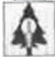
23 Pergerakan Tarbiyah Islamiyah (Perti)