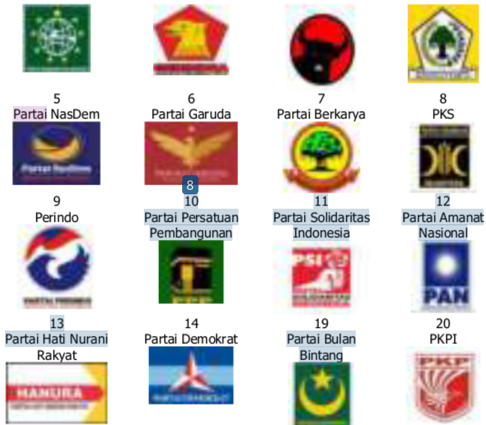
Gambar 40. Partai Peserta Pemilu 2019

Selain keenambelas partai politik ini, Pemilu 2019 juga diikuti oleh empat partai local Aceh, yakni: Partai Aceh, Partai Soliditas Independen Rakyat Aceh (Partai Sira), Partai Daerah Aceh (PD Aceh), dan Partai Nangroe Aceh (PNA). Dari 16 partai politik peserta pemilihan Umum 2019, terdapat 4 (empat) partai politik baru, yakni: Partai Solidaritas Indonesia (PSI), Partai Persatuan Indonesia (Perindo), Partai Berkarya dan Partai Gerakan Perubahan Indonesia (Garuda).