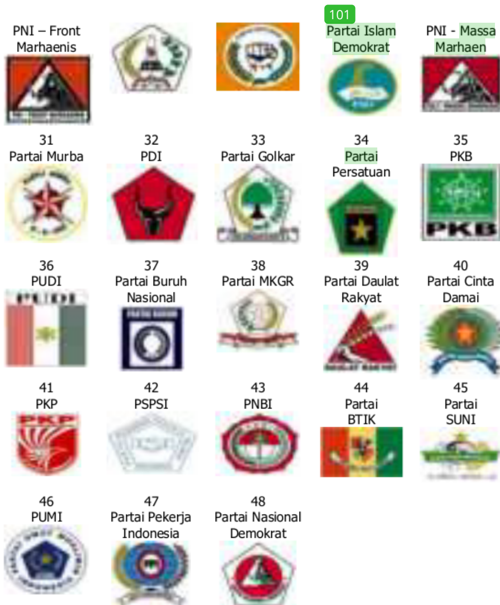
Gambar 34. Partai-Partai Peserta Pemilihan Umum 1999

Partai Golongan Karya dalam Pemilihan Umum 1999 yang semula diragukan. Namun mampu memperoleh suara besar dan secara nasional menduduki urutan kedua hasil pemilihan Umum 1999. Posisi ini dianggap karena kemampuan Partai Golongan Karya mengkonsolidasikan diri pada Musyawarah Nasional 1998. Golongan Karya merubah dirinya menjadi Partai Politik dengan paradigma baru, yang bertujuan ingin menunjukkan kepada masyarakat bahwa Golkar baru bersifat reformis yang berbeda dengan Golkar lama. Partai Golkar