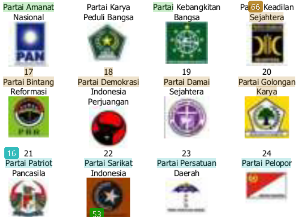
Gambar 38. Partai Politik Peserta Pemilihan Umum 2004

Pemilihan Umum 2004 menggunakan landasan yuridis Undang-Undang No. 12 Tahun 2003 melalui model pencantuman daftar nama calon anggota legislatif dalam surat suara, sehingga format surat suara yang dicetak KPU menjadi sangat besar dan lebar. Namun demikian masyarakat pemilih bisa langsung memilih calon di setiap daerah pemilihan. Dengan berbagai kekurangan yang terjadi, Pemilu 2004 yang diikuti oleh 24 (dua puluh empat) parpol peserta pemilu berhasil diselenggarakan, meskipun tingkat kerumitannya tinggi akibat surat suara harus berbeda antar-daerah pemilihan, baik bagi DPR RI maupun DPRD provinsi dan DPRD kabupaten/kota dan potensi tertukar antar-daerah pemilihan serta kesalahan cetak sangat tinggi.