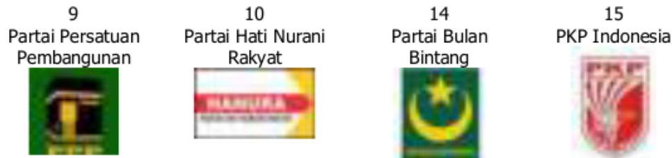
Gambar 39. Partai Peserta Pemilihan Umum 2014

Ada 12 Partai Politik peserta Pemilihan Umum 2014, ditambah 3 partai lokal Aceh, yakni: nomor urut 11. Partai Damai Aceh, nomor urut 12. Partai Nasional Aceh, dan nomor urut 13. Partai Aceh. Partai peserta Pemilu 2014 terdapat 9 partai yang ikut Pemilu 2009 sebelumnya. Ada 3 partai yang baru ikut, yakni Partai Nasional Demokrat (Nasdem), Partai Gerakan Indonesia Raya (Gerindra) dan Partai Hati Nurani Rakyat (Hanura).