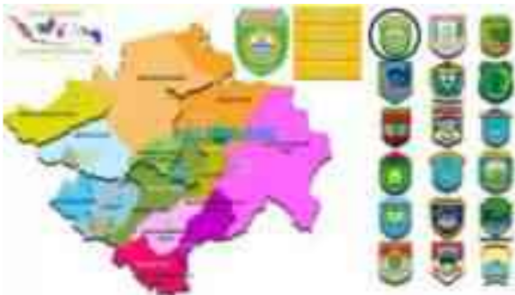
Gambar 1. Peta Provinsi Sumatera Selatan

Provinsi Sumatera Selatan memiliki topografi yang bervariasi mulai dari daerah pantai, dataran rendah, dataran tinggi, dan pegunungan. Wilayah Sumatera Selatan memiliki bentangan wilayah dari Barat ke Timur dengan ketinggian antara 400 - 1.700 meter di atas permukaan laut (mdpl). Wilayah dengan ketinggian rata-rata antara 900 – 1.200 mdpl berada pada bagian Barat yang merupakan pegunungan Bukit Barisan. Pegunungan Bukit Barisan ini memiliki puncak-puncak dengan ketinggian tertinggi berada di Gunung Dempo (3.159 mdpl), Gunung Bungbuk (2.125 mdpl), Gunung Semuning (1.964 mdpl), dan Gunung Patah (1.107 mdpl). Daerah ini tersusun dari bentukan lembah, dataran tinggi plateau dan kerucut vulkanik. Wilayah pegunungan dan bukit-bukit maupun dataran rendah sebagian besar ditutupi hutan lebat dan tebal. Dilereng Gunung Semuning terentang daratan seluas 128 KM 2 . Terdapat Danau Ranau yang memiliki panorama keindahan alam luar biasa.