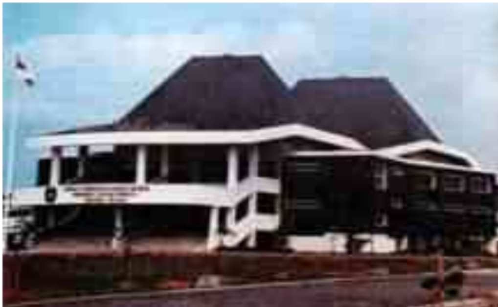
Gambar 29. Gedung Baru DPRD Provinsi Sumatera Selatan dengan ciri arsitektur Rumah Limas Sumatera Selatan yang anggun

Sultan Mahmud Badaruddin II sebagai Pahlawan Nasional. Surat Keputusan ini bernomor 063/TK/1984.