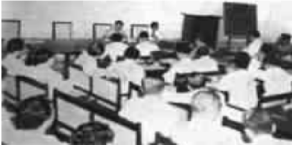
Gambar 12. Suasana rapat pleno VI DPRD-S 27 Februari 1953.

Mengenai anggaran belanja yang di sodorkan sebagai hasil sidang lengkap DPRD Sumsel prinsipnya telah disetujui oleh pemerintah pusat terutama mengenai anggaran belanja Dewan Perwakilan Rakyat sejumlah Rp 2.726.000. Untuk itu dalam bulan ini juga akan datang ke Palembang Kepala Keuangan Kementrian Dalam Negeri yang khusus membicarakan soal-soal keuangan yang menjadi kesulitan didaerah Sumatera Selatan ini.