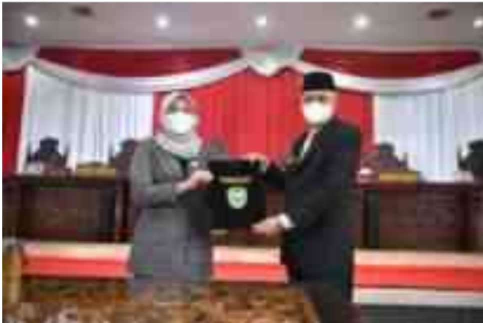
Gambar 44. Peresmian Pembahasan Sembilan Raperda di DPRD Provinsi Sumatera Selatan

Sementara pada tahun 2022, DPRD Provinsi Sumatera Selatan membuat sembilan Rancangan Peraturan Daerah (Raperda) dalam Propemperda. Kesembilan Raperda tersebut terdiri dari empat Raperda inisiatif DPRD Provinsi Sumatera Selatan dan lima Raperda Usul Eksekutif.