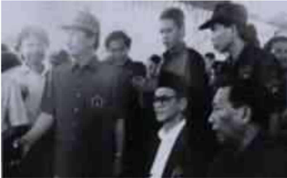
Gambar 33. Ketua Umum PPP dalam Kampanye Pemilu 1992 di Lapangan Nigata Plaju

Menjelang Pemilihan Umum 1992, mulai banyak kritik yang muncul bahwa para calon anggota DPRD Provinsi Sumatera Selatan tersebut, kurang mencerminkan aspirasi dan kepentingan rakyat di daerah pemilihnya. Sehingga hanya mewakili kepentingan golongan maupun partainya sendiri.