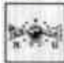
29 Partai Rakyat Indonesia (PARI)