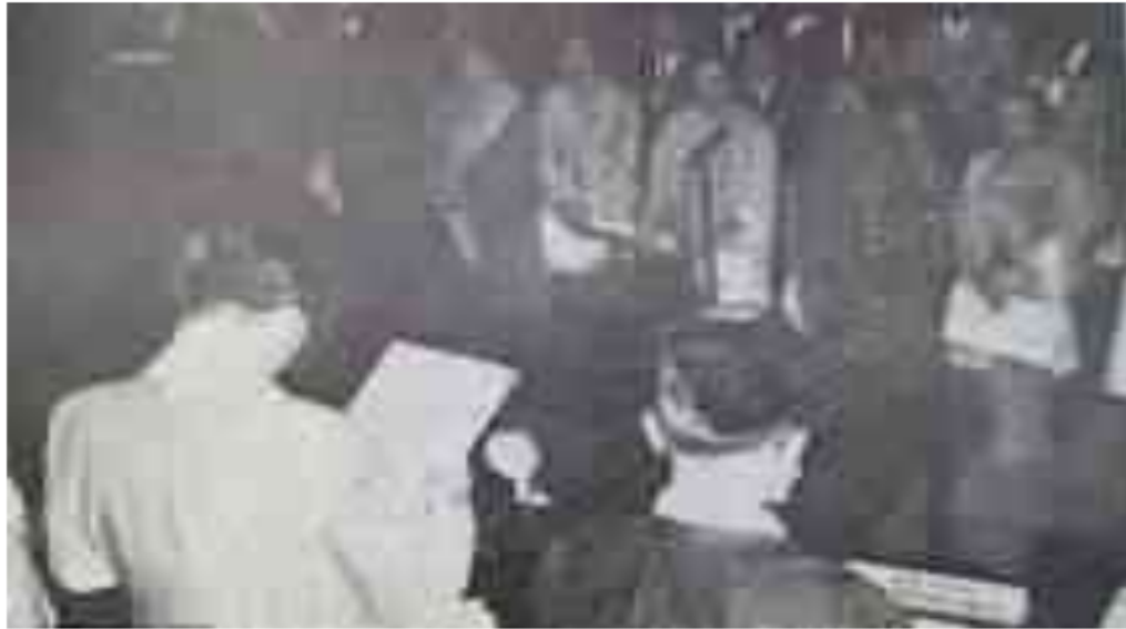
Gambar 18. Pelantikan Anggota DPRD Sumsel hasil Pemilihan Umum 1971