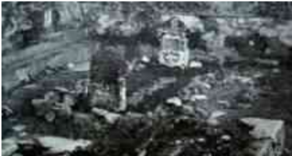
Gambar 28. Makam Sultan Mahmud Badaruddin II di Kampung Palembang, Ternate tahun 1983

Tim bentukan DPRD Provinsi Sumatera Selatan Periode 1982-1987 menghadap Menteri Sosial Republik Indonesia dalam melengkapi data perjuangan, kesetiaan dan tindak kepahlawanan Sultan Mahmud Badaruddin II dalam memimpin pertempuran dengan penjajah pada perjuangan mencapai kemerdekaan Indonesia di daerah Sumatera Selatan.