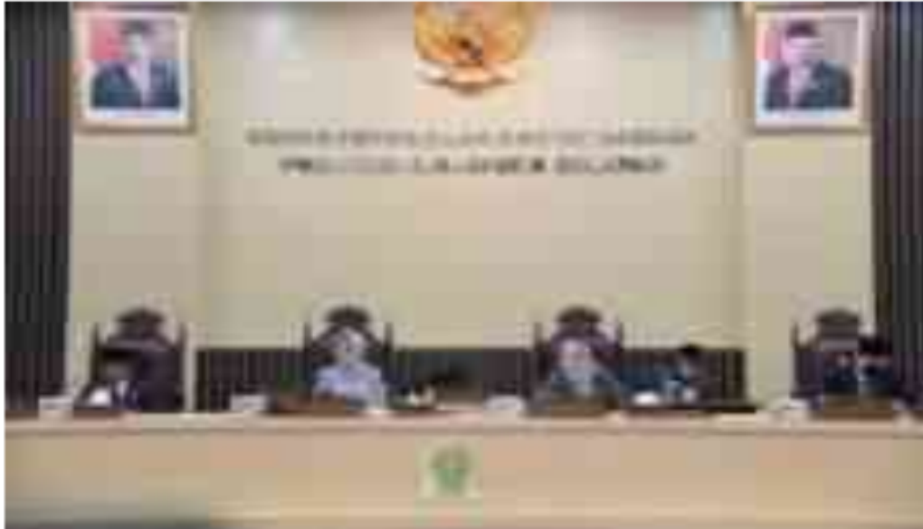
Gambar 41. Sidang rapat Paripurna DPRD Provinsi Sumatera Selatan Masa Jabatan 2019-2024

Pelantikan Anggota DPRD Sumatera Selatan periode 2019-2024 terpilih dilakukan pada tanggal 24 September 2019. Pelantikan dilakukan dalam rapat paripurna ke-LXV (65) di Gedung DPRD Provinsi Sumatera Selatan di Jalan Kapten A. Rivai, Palembang dengan agenda pengucapan sumpah dan janji 75 anggota DPRD Sumsel terpilih.