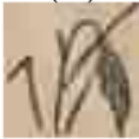
25 Partai Sosialis Indonesia (PSI)