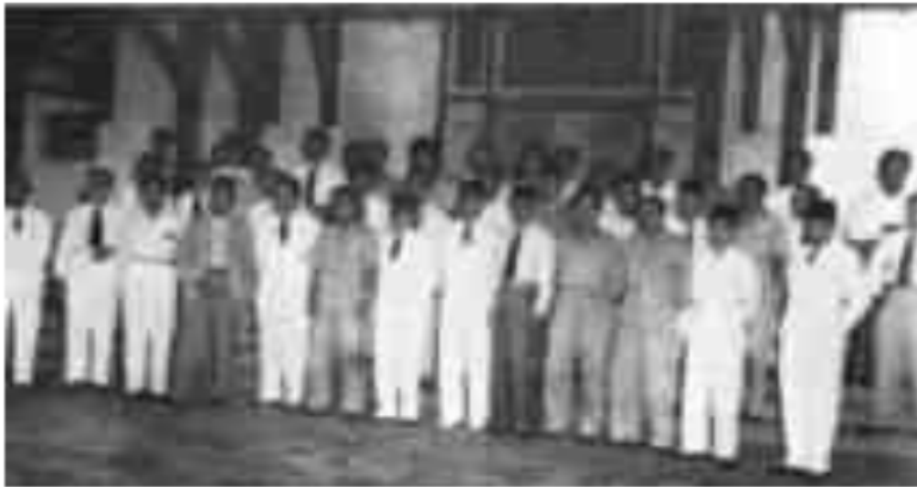
Gambar 4. Foto bersama Anggota DPRD dengan Gubernur Dr. M. Isa

sesuai fungsinya oleh anggota-anggota dari partai politik yang ada di Sumatera Selatan.