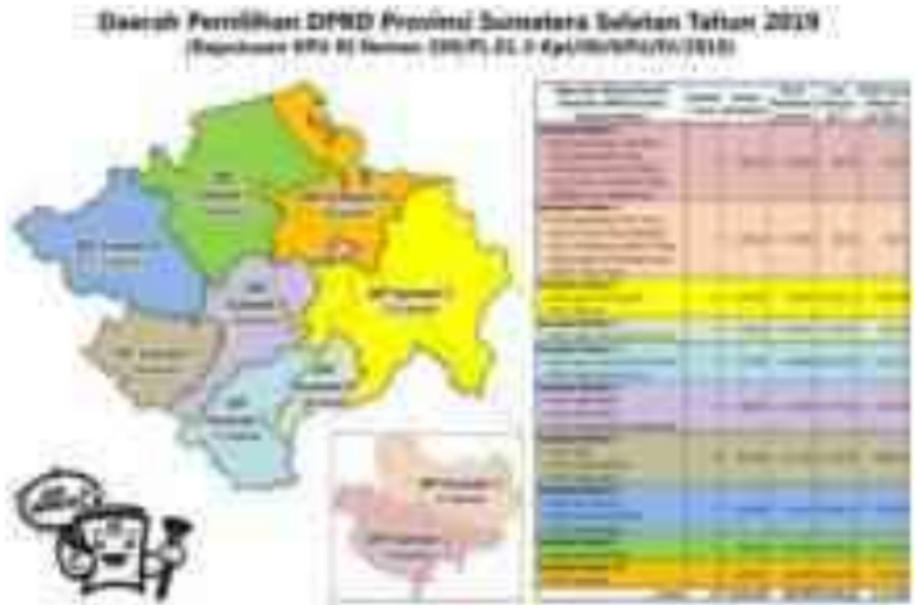
Gambar 3. Pembagian Dapil Pemilu 2019 di Sumatera Selatan