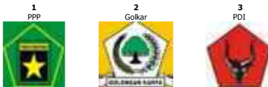
Gambar 30. Organisasi Peserta Pemilihan Umum 1987

dirugikan akibat kewajiban asas tunggal Pancasila dan penggantian logo.