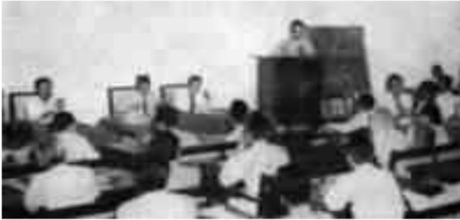
Gambar 10. Gubernur Sumatera Selatan menguraikan keadaan daerah di rapat pleno DPRD-S 1950-1955