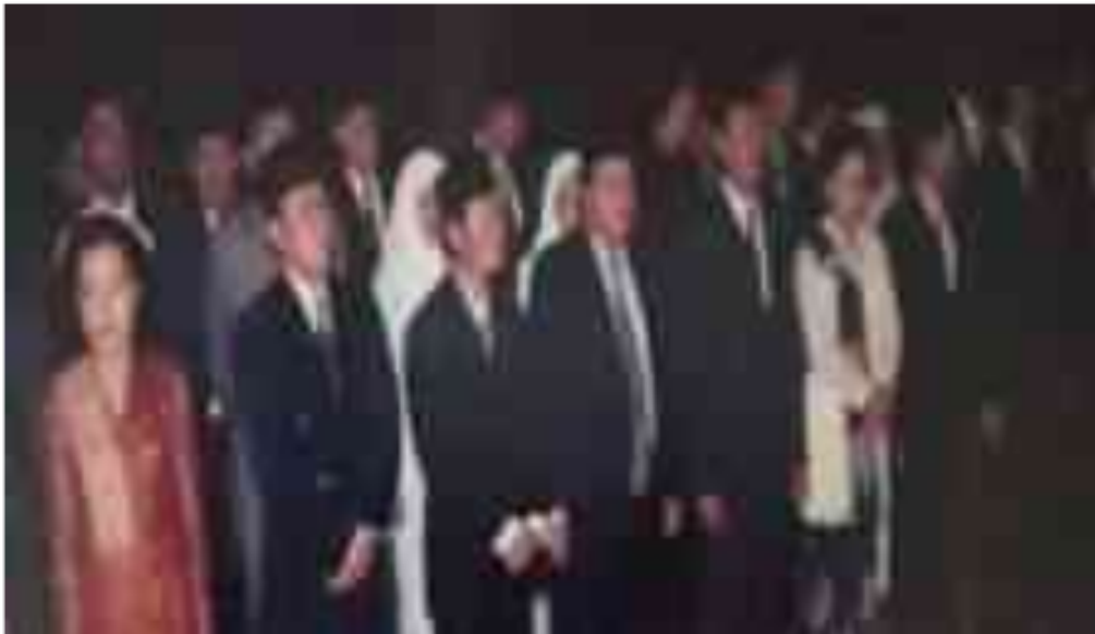
Gambar 35. Peresmian Keanggotaan dan Pimpinan DPRD Provinsi Sumatera 1999-2004