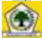
5 Partai Golongan Karya