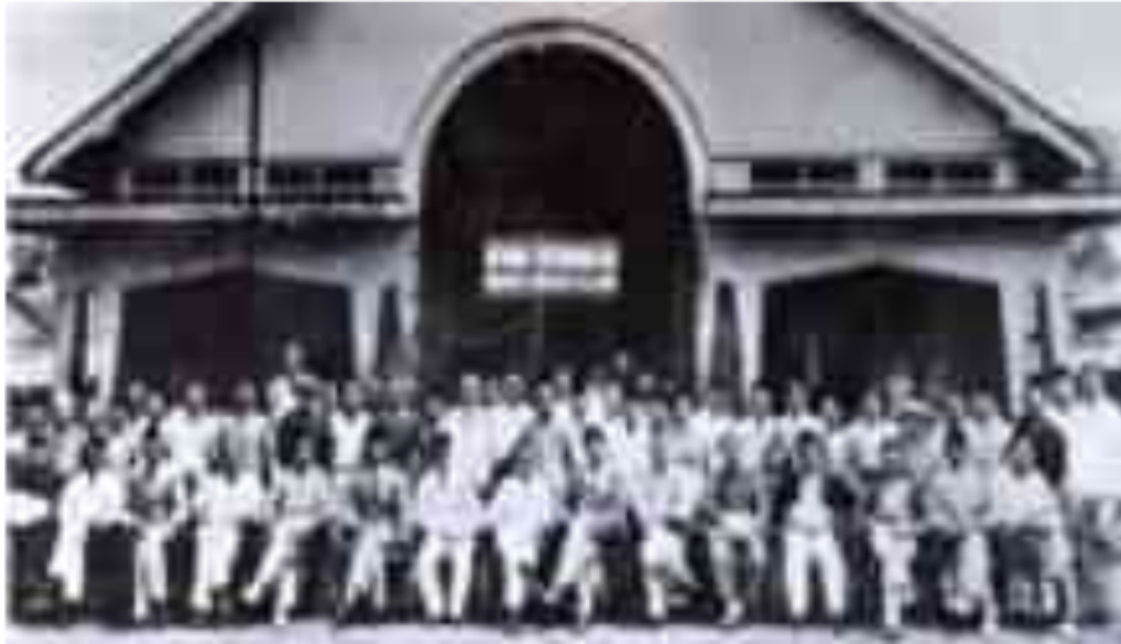
Gambar 2. Foto bersama Anggota DPRD-S 1948-1950 didepan Gedung Dewan Perwakilan Provinsi Sumatera Selatan (Gedung Nasional) di Curup, tanggal 20-23 Oktober 1948