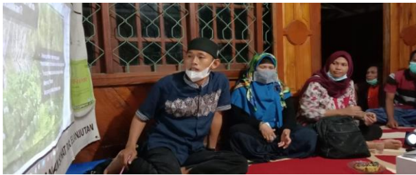
Gambar 4. Sosialisasi pada saat temu tani

Ada beberapa poin penting dalam pelaksanaan kegiatan dan materi yang disampaikan yaitu: