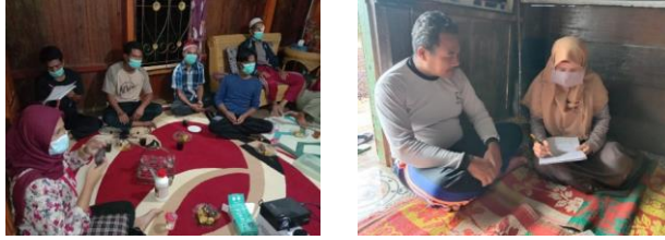
Gambar 1. Sosialisasi dengan pengisian kuesioner

Adapun pertanyaan kuesioner meliputi identitas responden dan keadaan lahan kebun, budaya bertani, dan keadaan ekonomi. Salah satu pertanyaan pada budaya bertani yang menjadi topik pada kegiatan PPM ini adalah masalah pemupukan dan penggunaan herbisida. Ada 26 responden yang merupakan petani kopi di Desa Rimba Candi. Tabel 1 berikut ini merupakan rekapitulasi beberapa jawaban kuesioner pada pertanyaan tersebut. Ada beberapa pertanyaan tersebut hanya dikhususkan pada petani yang sudah menggunakan reduktan herbisida.