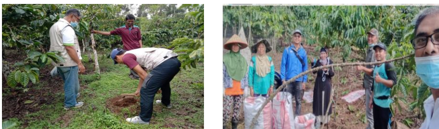
Gambar 3. Foto-foto Kegiatan studi dan diskusi di Lahan Kebun Kopi

Selanjutnya juga dilakukan sosialisasi/penyuluhan dengan mengumpulkan petani pada saat temu tani. Lokasi tempat penyuluhan dilakukan di rumah ketua salah satu kelompok tani di Desa Rimba Candi. Tim pelaksana juga berkunjung ke lahan kebun kopi bapak ketua tersebut untuk studi di lapangan dan melihat keadaan perawatan lahan. Tim pelaksana juga berdiskusi dan memperlihatkan bahwa akar pohon kopi berada di permukaan tanah. Jika lahan banyak gulmanya, maka akar tanaman kopi akan berebut hara dengan gulma dan lahan mengakumulasi residu bahan aktif dari herbisida. Foto-foto kegiatan dapat dilihat pada Gambar 3 dan Gambar 4.