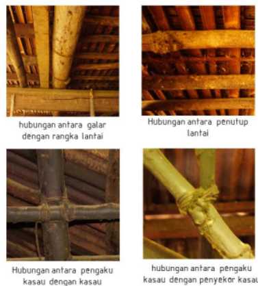
Gambar 3 Hubungan ikat pada komponen konstruksi bagian bawah Ghumah Baghi dan bagian atas

kasau, lisplank dengan alang panjang dan kasau dengan reng.