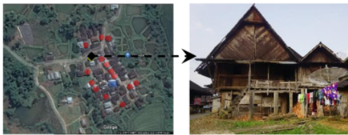
Gambar 1 Lokasi dan obyek penelitian

Dataran Tinggi Bukit Barisan bagian tengah berada di Sumatera Bagian Selatan memiliki 3 (tiga) wilayah budaya yang dominan yaitu Rejang di Bengkulu, Komering di Danau Ranau dan Pasemah di sekitar Gunung Dempo, dari ketiga suku ini melakukan migrasi melalui sungai dari ulu ke ilir, Suku Rejang dari ulu Sungai Rawas dan Musi, Suku Komering dari ulu Sungai Komering dan Suku Pasemah dari ulu Sungai Lematang (Bart 2004). Ghumah Baghi adalah salah satu produk kebudayaan Suku Basemah dengan disain arsitektur dan struktur yang dipengaruhi oleh perpindahan, Migrasi, pergerakan dan ekspansi memiliki kontribusi yang luas terhadap tipe rumah di Indonesia bagian barat (Bart 2004). Sistem prefabrikasi dengan konstruksi bongkar pasang (knock-down) merupakan sistem konstruksi Ghumah Baghi sebagai solusi dari perpindahan yang dilakukan oleh Suku Pasemah (Arios 2012) (Refisrul 2012) (Rinaldi dan Purwantiasning 2015). Objek studi dalam penelitian ini adalah Ghumah Baghi di Desa Bangke, Kecamatan Kota Agung Kabupaten Lahat Provinsi Sumatera Selatan. Gambar 1 menunjukkan lokasi dan objek pada penelitian ini.