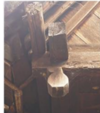
hubungan antara alang panjang

Gambar 5 Hubungan lobang dan purus dengan pasak pada komponen konstruksi bagian bawah Ghumah Baghi dan bagian atas