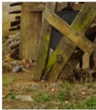
hubungan antara rangka tangga dengan anak tangga

Gambar 5 menunjukkan hubungan lobang dan purus dengan pasak yang merupakan hubungan lobang dan purus diperkuat pasak kayu. Hubungan Lubang dan purus pada konstruksi Ghumah Baghi meliputi 3,1 % dari jumlah keseluruhan hubungan komponen, hubungan lubang dan purus dengan pasak terdapat pada rangka tangga dengan anak tangga dan alang lebar dengan alang lebar.