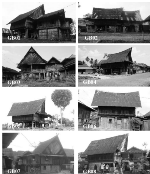
Gambar 3 Wujud Ghumah Baghi

Perkembangan dan pengaruh kebudayaan luar mempengaruhi pemanfaatan ruang pada Ghumah Baghi, terjadi pergeseran pemanfaatan ruang dan penambahan ruang sehingga akan mempengaruhi citra ruang dan citra wujud. Penelitian ini bertujuan mengidentifikasi pola perubahan pemanfaatan dan penambahan ruang pada Ghumah Baghi sebagai akibat perubahan budaya, kebutuhan sosial dan ekonomi. Manfaat penelitian ini menjadi data awal dari usaha untuk memberikan arahan perubahan dan penambahan ruang yang tetap memperhatikan citra ruang dan citra wujud Ghumah Baghi (gambar 3).