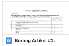
Borang Artikel #2..