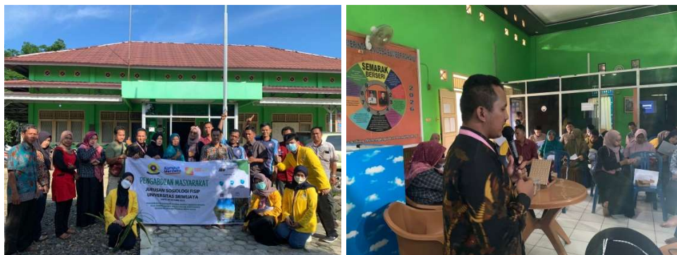
Gambar 2. Pelatihan Penguatan Pengelolaan BUMDes

Temuan dilapangan bahwa banyak kendala yang dihadapi oleh BUMDes dalam mengembangkan usaha BUMDes. Adapun masalah yang dihadapi adalah Sumber Daya Manusia atau pengelola BUMDes kurang melakukan inovasi terhadap produk BUMDes sehingga produk BUMDes belum dikenal secara luas oleh masyarakat. Produk BUMDes Semarak Berseri cukup beragam yaitu keripik, wisata air betung berseri, dan taman bunga. Produk yang ditawarkan BUMDes belum begitu dikenal oleh masyarakat hal ini dikarenakan promosi yang dilakukan BUMDes belum begitu massive . Namun meskipun belum begitu dikenal masyarakat produk BUMDes Semarak Berseri yaitu air betung berseri mampu bersaing ditingkat nasional, sebagai desa wisata nusantara tahun 2022. Berikut adalah gambar pelatihan yang dilakukan oleh tim pengabdian.