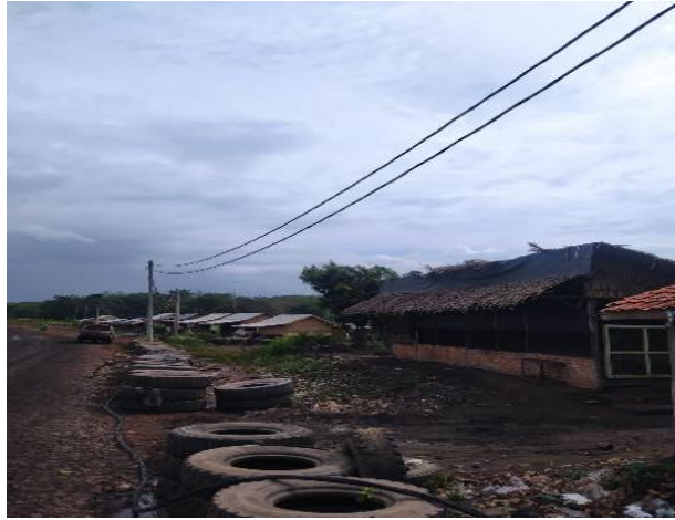
Gambar 1. 2 Kantin di lokasi pertambangan batu bara desa Lunas Jaya