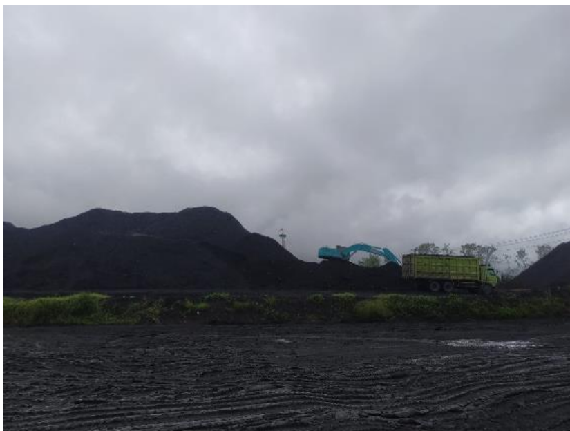
Gambar 1. 1. Kegiatan pertambangan batu bara di desa Lunas Jaya

Pertambangan batubara dapat mempercepat pertumbuhan ekonomi, mendorong pembangunan daerah, memberikan keuntungan ekonomi lokal dan nasional, memberikan peluang bisnis yang mendukung, membangun infrastruktur baru, menciptakan lapangan kerja, membuka daerah terpencil, dan membawa pengetahuan teknologi kepada masyarakat pertambangan.