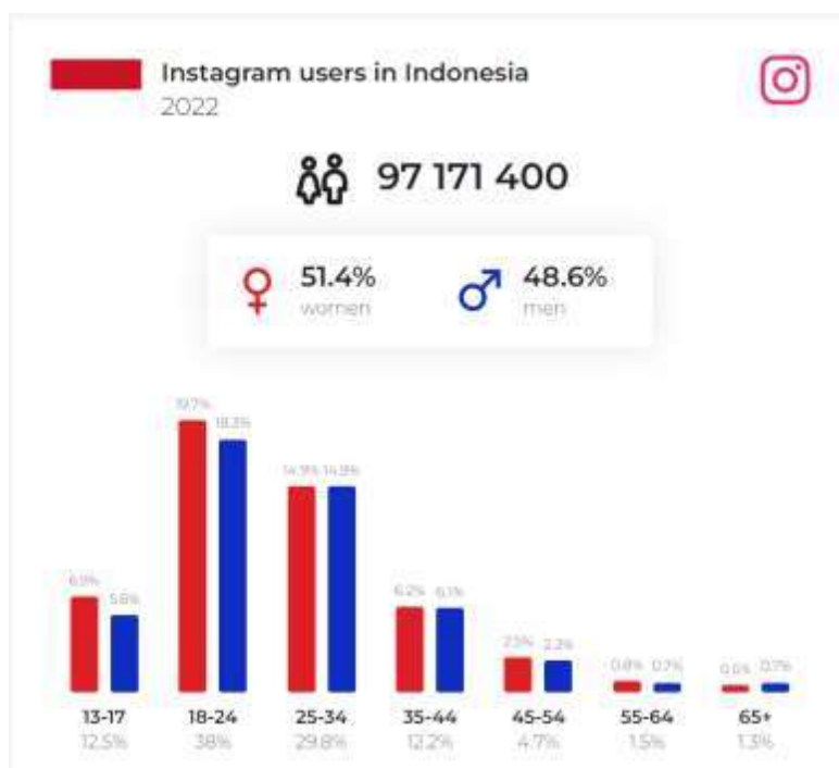
Grafik 1. 1 Pengguna Instagram di Indonesia Desember 2022