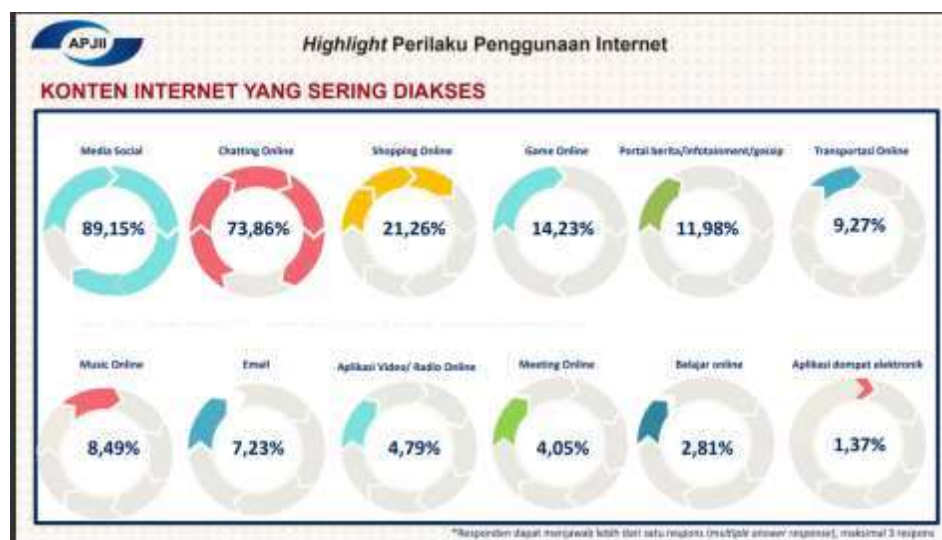
Diagram 1. 1 Konten Internet yang Sering Diakses