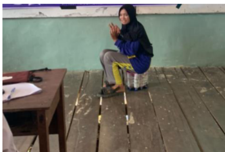
Gambar 5. Kursi Ecobrick

Penyampaian materi dilaksanakan secara dua arah dimana terdapat interaksi antara pemateri dengan siswa. Setelah dilakukan penyampaian materi, siswa ditunjukkan dengan hasil daur ulang sampah plastik berupa kursi dari ecobrick. Pada awalnya, siswa tidak mengira jika sampah plastik dapat didaur ulang menjadi kursi. Terdapat salah satu siswa yang mencoba duduk dikursi tersebut yang terlihat pada Gambar 5.