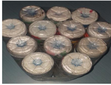
Gambar 2. Kursi dari ecobrick