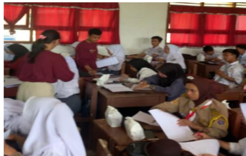
Gambar 3. Pelaksanaan Pre-Test

Kegiatan pengabdian ini ditujukan kepada siswa dan siswi SMAN 1 Banyuasin II dengan harapan agar generasi muda Desa Sungsang dapat peduli dengan lingkungannya melalui pemanfaatan sampah plastik menjadi ecobrick. Kegiatan ini juga melibatkan mahasiswa dari Jurusan Ilmu Kelautan, Universitas Sriwijaya. Kegiatan diawali dengan pembukaan dan pengenalan oleh MC yang akan memandu acara penyuluhan. Kemudian, dilakukan Pre-Test kepada siswa SMAN 1 Banyuasin II untuk melihat pemahaman siswa mengenai sampah plastik dan pemanfaatannya menjadi ecobrick. Pre-Test berisi pertanyaan seperti pengetahuan umum mengenai sampah plastik, kesadaran lingkungan, perilaku siswa, serta pemanfaatan menjadi ecobrick.