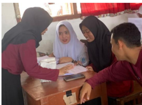
Gambar 6. Pelaksanaan Post-Test

Setelah penyampaian materi dan pengenalan siswa dengan hasil daur ulang sampah plastik menjadi ecobrick, evaluasi kegiatan dilakukan untuk mengetahui sejauh mana kegiatan penyuluhan ini bermanfaat bagi siswa SMAN 1 Banyuasin II, dilakukan kegiatan post-test pada Gambar 6.