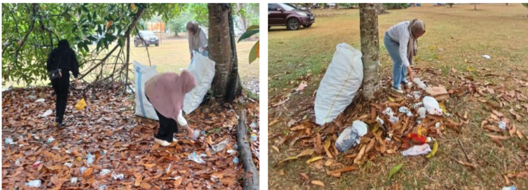
Gambar 1. Pengumpulan Sampah Plastik

Ecobrick merupakan hasil daur ulang sampah plastik yang dapat dimanfaatkan menjadi kursi, meja, pagar rumah, dan sebagainya. Pembuatan ecobrick menggunakan bahan-bahan yang sederhana seperti botol plastik, kantong plastik, limbah plastik lain seperti plastik bekas sabun pencuci piring, bungkus makanan ringan, dan lainnya, gunting, batang kayu dan selotip. Sampah plastik dapat diambil dari lingkungan sekitar.