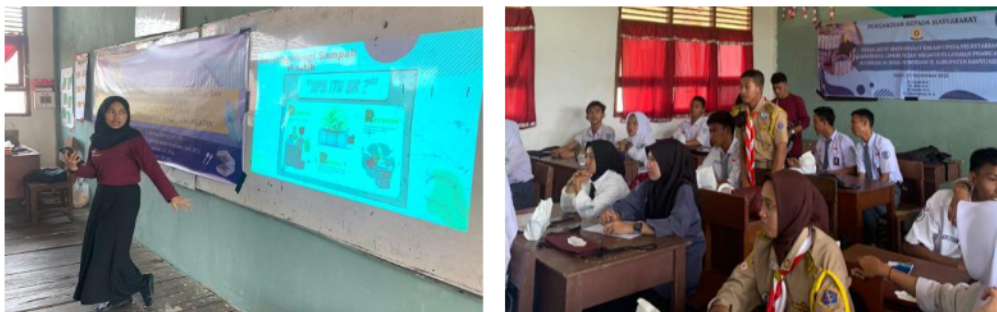
Gambar 4. Penyampaian Materi

Penyampaian materi dilaksanakan secara dua arah dimana terdapat interaksi antara pemateri dengan siswa. Setelah dilakukan penyampaian materi, siswa ditunjukkan dengan hasil daur ulang sampah plastik berupa kursi dari ecobrick. Pada awalnya, siswa tidak mengira jika sampah plastik dapat didaur ulang menjadi kursi. Terdapat salah satu siswa yang mencoba duduk dikursi tersebut yang terlihat pada Gambar 5.