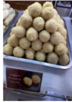
Foto 14 & 15. Adonan pempek tahu dan hasilnya. Foto 16. Pempek ada'an

Sedangkan untuk pempek keriting , adonannya ditambahkan sedikit sagu agar lebih kenyal dan tidak mudah hancur ketika direbus. Cara membuat pempek keriting juga membutuhkan keahlian khusus karena menggunakan alat piri'an yang terbuat dari kuningan. Adonan yang sudah disiapkan diambil secukupnya, diletakkan di atas damparan dan ditekan-tekan dengan piri'an hingga menghasilkan satu pempek keriting , sesuai ukuran yang telah ditetapkan oleh pemilik/pembuatnya. Selanjutnya, dimasukkan ke dalam panci yang airnya sudah mendidih, dimasak hingga matang. Hal ini dilakukan terus menerus, sesuai kebutuhan berapa banyak pempek keriting akan dihasilkan/dibuat. Cara penyajiannya sama dengan sebelumnya.