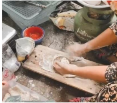
Foto 17 & 18. Alat Piri'an dan cara menggunakannya.

Pempek pistel adalah adonan pempek yang sudah disiapkan diisi dengan pistel (parutan pepaya muda, ditumis dengan bawang merah, bawang putih, garam dan sedikit gula pasir). Setelah diisi, pempek ini dipilin satu-satu hingga semuanya tertutup, dan direbus hingga matang. Proses memasukkan ke dalam panci dan mengangkatnya harus ekstra hati-hati karena jika lengah akan menyebabkan pempeknya hancur. Pempek pistel sangat digemari karena satu-satunya pempek yang diisi sayuran. Cara penyajiannya sama dengan pempek lenjer .