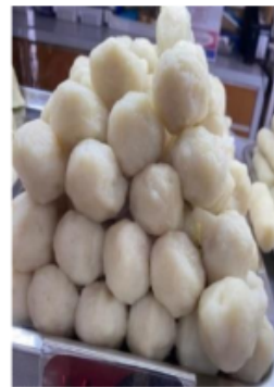
Foto 23 & 24. Proses pempek kapal selem dan hasilnya.