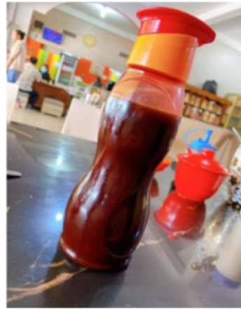
Foto 12 & 13. Proses pembuatan cuko dan cuko siap dimakan dengan pempek.

Khusus untuk pempek tahu , dan adaan , adonannya harus lebih lembut agar hasilnya lebih bagus. Kedua jenis pempek ini harus langsung digoreng. Jadi, pembuat pempek harus siap di depan kuili besar/ sedang yang telah diisi dengan minyak cukup banyak dan pempek dimasukkan satu persatu, digoreng hingga matang. Cara penyajiannya sama dengan pempek lenjer .