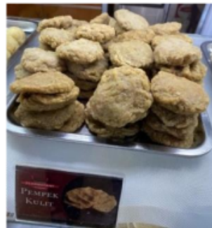
Foto 29 & 30. Daging ikan untuk pempek kulit dan pempek kulit.

Otak-otak Palembang dimakan dengan cuko . Berbeda dengan daerah lain yang dimakan dengan saus. Bahan baku otak-otak adalah sagu dan daging ikan giling, dengan komposisi lebih banyak ikan dibandingkan sagu. Selain itu, dimasukkan pula santan ke dalam kedua bahan yang telah disiapkan sebelumnya. Selanjutnya diaduk menjadi satu dengan ditambahkan garam, sedikit gula serta bumbu penyedap/kaldu. Adonan diambil sesuai keinginan, dibungkus dengan daun pisang. Cara memasaknya dengan dibakar atau sebagian orang memilih dikukus terlebih dahulu baru dibakar sejenak. Bau yang harum menggoda dimakan dengan cuko di dalam mangkuk kecil satu per satu.