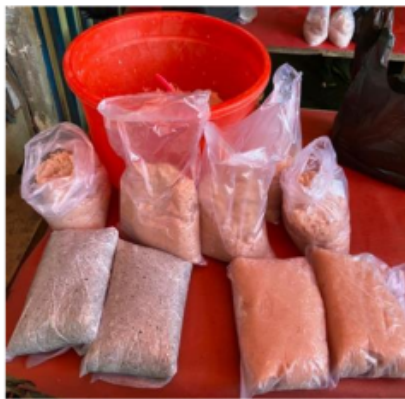
Foto 2. & 3. Ikan yang sudah dibuang tulangnya dan alat penggiling, juga daging giling

Lantas apa yang membedakannya jika banyak bahan bisa dijadikan pempek? Kuliner ini baru dapat dikatakan pempek jika disandingkan dengan cuko . Cuko inilah yang menjadi “ciri”, sehingga disebut pempek. Bahan dasar cuko adalah gulo abang , bawang putih dan cabai (rawit, keriting). Kedua bahan tersebut digiling menjadi satu