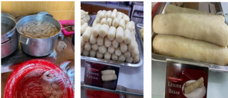
Foto 9, 10 & 11. Proses pembuatan pempek lenjer . Lenjer kecil dan lenjer besar

pempek, dan menghirupnya pelan-pelan sesuai kebutuhan penikmat pempek). Bagi wong Palembang pempek tanpa cuko bagaikan makan nasi tanpa lauk. Bahkan ada pernyataan yang cukup populer “yang penting cukonyo, pempeknyo nyusul. Kalu cuko lemak, pempek apo be melok lemak.” (Artinya: yang penting cuko nya, pempeknya menyusul. Jika cukanya enak, pempek apa saja ikut enak). (Wawancara dengan Vebri al-Lintani, 8 Agustus 2021).