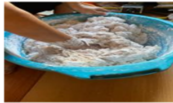
Foto 7. Mesin mengolah daging ikan dan air. Foto 8. Mencampur daging ikan olahan dengan sagu.

Dari adonan tersebut dapat dibuat pempek jenis lenjer ( besak dan kecik ), tahu , ada'an , keriting , pistel , kapal selem ( telok besak ), telok , tunu/panggang dan isi , lenggang ( tunu dan goreng), rujak mie . Kulit dan otak-otak . Pempek lenjer dibentuk memanjang dari adonan yang telah tersedia. Lenjer besak ditandai dari ukuran panjang dan diameter (sekitar diameter dua sentimeter dengan panjang tiga puluh sentimeter). Setelah siap langsung direbus di dalam panci yang airnya sudah mendidih hingga matang. Lenjer besak yang sudah matang, diiris-iris sesuai selera (biasanya disesuaikan dengan ukuran pempek kecik ). Setelah semua selesai dapat langsung dimakan (begitu pula lenjer kecil ) atau digoreng terlebih dahulu bersama cuko . Cara memakannya adalah cuko dimasukkan ke dalam mangkuk-mangkuk kecil dan pempek diambil satu per satu untuk dimakan sambil ngighup cuko ( ngighup adalah mangkuk diarahkan ke dalam mulut yang masih dipenuhi oleh