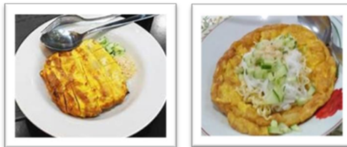
Foto 21 & 22. Lenggang tunu dan lenggang goreng.

Pempek lenggang adalah jenis pempek yang berbeda, walaupun bahan bakunya sama sehingga tetap menggunakan adonan dasar yang sudah tersedia ( lenjer ). Pertama-tama yang dilakukan adalah mengocok beberapa telur ayam/bebek (biasanya pengusaha pempek menggunakan telur ayam sebab telur bebek harganya lebih mahal). Selanjutnya menggabungkan irisan pempek kedalam kocokan telur, dan memasukkannya ke dalam wadah yang terbuat dari daun pisang yang telah dibentuk seperti mangkuk. Setelah semuanya siap, pempek ditunu /dipanggang di atas bara arang kayu/batok kelapa hingga matang. Lenggang goreng sama dengan bakar, perbedaannya pada cara memasangnya yaitu disiapkan minyak goreng di teflon atau kuali dan adonan pempek telur digoreng hingga matang. Semua itu dapat segera disajikan di dalam mangkuk dan ditambahkan cuko dan irisan temun serta ebi di atasnya. Kelezatan semakin terasi jika dimakan dalam kondisi masih panas.