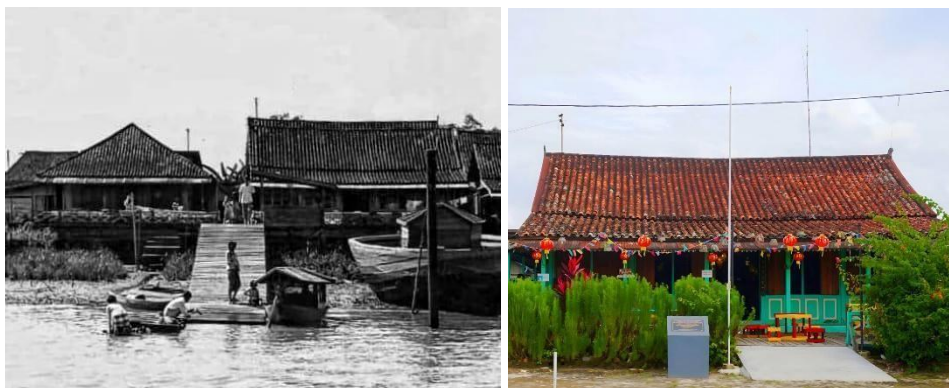
Gambar 5. Rumah Baba Ong Boen Tjit pada masa penjajahan Belanda dan pada masa kontemporer

Masyarakat telah mengembangkan destinasi wisata sejarah yang dapat membantu perekonomian, yaitu destinasi wisata Rumah Baba Boen Tjit. Rumah Baba Boen Tjit adalah sebuah rumah yang didirikan oleh seorang pedagang hasil bumi bernama Ong Eng Tuan, seorang saudagar asal China yang datang ke Palembang untuk berdagang, terutama rempah-rempah. Setelah menetap di Palembang, Ong Eng Tuan menikah dengan seorang perempuan pribumi keturunan Palembang. Setelah pernikahan mereka, Ong Eng Tuan membangun rumah di tepi Sungai Musi, yang kini dikenal sebagai rumah Baba Boen Tjit. Rumah ini diyakini telah berusia sekitar 300 tahun, hal ini dapat diketahui dari Altar nenek moyang yang terletak di ruangan belakang rumah Baba Boen Tjit, yang menunjukkan tahun dari abad ke-18 (wawancara dengan ibu Ani pada 1 Februari 2023).