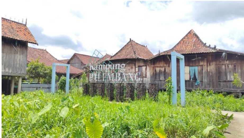
Gambar 2. Kampung Palembang di Kelurahan 3-4 Ulu

jasa. Sehingga Palembang menjadi tujuan untuk mengembangkan perekonomian yang lebih baik (Taufik, dkk, 2019., Wargadalem, 2023., Tjiptoherijanto, 1999).