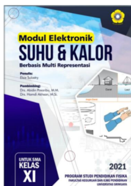
Gambar 2. Cover Modul Elektronik

tahun pembuatan modul elektronik dan identitas program studi. Cover pada modul elektronik ini dapat dilihat pada gambar 2 di bawah ini.