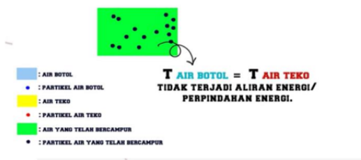
Gambar 3. Tampilan Video Asas Black pada Modul Elektronik

Bagian inti menjabarkan tujuan pembelajaran, materi setiap kegiatan pembelajaran, rangkuman, latihan soal dan soal evaluasi. Modul elektronik ini berisi tiga kegiatan pembelajaran yaitu mengenai suhu, kalor dan perpindahan kalor. Setiap kegiatan inti dijelaskan dengan penyajian multi representasi yang berisi definisi materi secara verbal, persamaan matematis yang digunakan, penyajian gambar pengukuran suhu dan sebagainya, serta penyajian grafik anomali air. Selain itu, e-modul ini juga menampilkan video pembelajaran dan link akses artikel yang dapat menambah wawasan peserta didik dalam belajar. Salah satu tampilan video yang disajikan pada e-modul dapat dilihat pada gambar 3 di bawah ini.