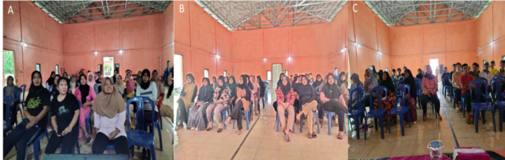
Gambar 1. Penyampaian materi di gedung Balai Desa Tanjung Dayang Utara, pertemuan pertama (A), pertemuan kedua (B), dan pertemuan ketiga (C)

budidaya bawang merah (Gambar 1). Kegiatan pengabdian ini dilakukan di Desa Tanjung Dayang Utara dari bulan Juli sampai September 2023. Bimbingan teknis budidaya bawang merah dilakukan dengan membuat demplot budidaya bawang merah, meliputi persiapan media tanam, penanaman, pemeliharaan dan panen (Gambar 2).