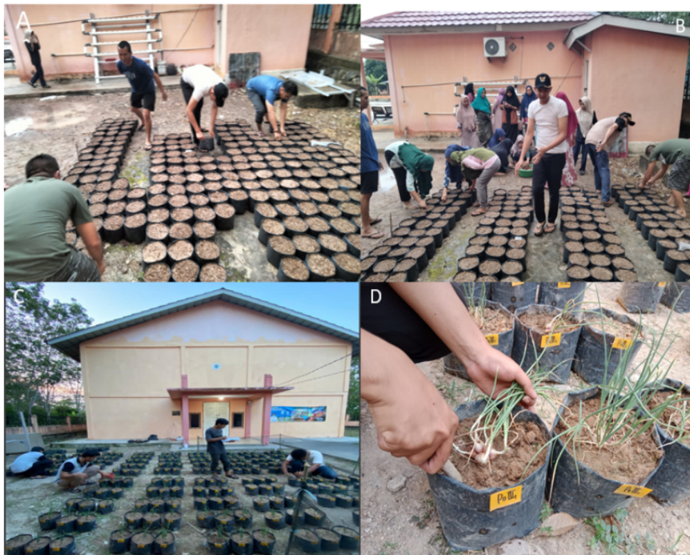
Gambar 2. Persiapan media tanam (A); penanaman (B); pemeliharaan (C); dan panen (D)