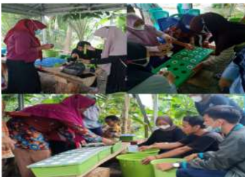
Gambar 5. Foto-foto kegiatan penanaman

Setelah bibit pada persemaian berumur 2 minggu, lalu dilakukan penanaman. Persiapan sebelum tanam adalah menyiapkan wadah tempat penanaman yang telah berisi larutan nutrisi, lalu bibit beserta rockwool sebagai media dimasukkan kedalam netpot yang telah diberi sumbu dialasnya, seperti yang tertera pada Gambar 5.