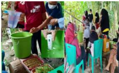
Gambar 4. Foto-foto kegiatan pembuatan nutrisi

hidroponik. Kegiatan pembuatan nutrisi tertera pada Gambar 4.