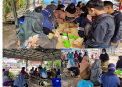
Gambar 3. Foto kegiatan penyemaian

Kegiatan selanjutnya adalah penanaman tanaman sayuran dengan metode hidroponik sederhana atau metode wick. Tahapan kegiatan dimulai dengan penyemaian. Kegiatan penyemaian dilakukan seperti yang tertera pada Gambar 3.