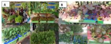
Gambar 6. Foto Tim Pengabdian dan tanaman yang dipanen serempak (A) dan yang dipanen tidak serempak (B)

dari budidaya tanaman sayuran secara hidroponik adalah panen. Tanaman yang dipanen lebih kurang berumur 3-4 minggu. Tanaman yang dilakukan panen serempak adalah Pakcoy putih, Pakcoy hijau, Selada putih, Selada merah dan Caisim (Gambar 6A). Sedangkan, tiga tanaman lain yaitu Bayam merah, Selada merah dan Sawi dipanen tidak bersamaan (Gambar 6B).