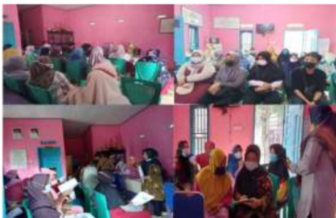
Gambar 2. Foto-foto beberapa kegiatan penyampaian materi

Pelaksanaan pengabdian dengan skema kegiatan adalah Perkuliahan Desa telah dilaksanakan selama 3 bulan sejak bulan Agustus sampai November 2021 di Desa Permata Baru Kecamatan Inderalaya Utara, Kabupaten Ogan Ilir. Kelompok masyarakat yang menjadi objek adalah ibu-ibu anggota Kelompok Wanita Tani (KWT) Permata Hijau sebanyak 24 orang, yang terbagi dalam 8 kelompok.