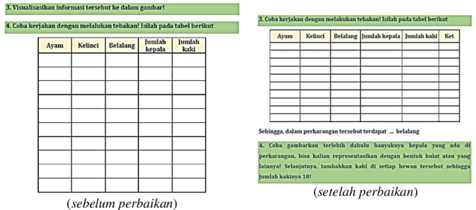
Gambar 3. Perbaikan LAS 2

DOI: https://doi.org/10.24127/ajpm.v11i4.6169