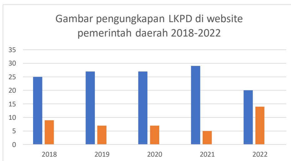
Gambar 1.1 Pengungkapan LKPD di website pemerintah daerah 2018-2022

Berdasarkan hasil pengamatan terhadap website pemerintah daerah provinsi di Indonesia menunjukkan terdapat 25 pemerintah daerah yang mengungkapkan laporan keuangannya di website masing-masing, sedangkan 9 pemerintah daerah tidak mengungkapkannya pada tahun 2018. Jumlah ini mengalami peningkatan setiap tahunnya dengan 27 pemerintah daerah di 2019 dan 2020 serta 29 pemerintah di tahun 2021. Namun, pada tahun 2022 hanya 20 pemerintah daerah yang mengungkapkan laporan keuangannya di website masing-masing sedangkan 14 pemerintah daerah tidak mengungkapkannya.