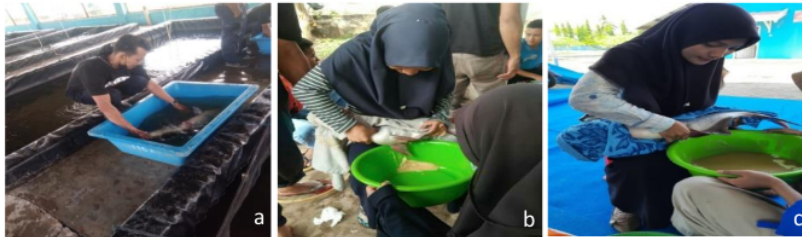
Gambar 5 a) Anestesi induk b) Striping induk betina c) Striping induk jantan

Striping dilakukan secara hati-hati, dan telur yang diperoleh ditampung di dalam wadah atau baskom kering. Induk jantan yang telah dianestesi selanjutnya di- striping dan sperma dari induk jantan kemudian dicampurkan kedalam telur (Gambar 5).