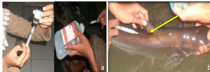
Gambar 4 a) Pengambilan hormon dan NaCl, b) Penyuntikan induk

Waktu penyuntikan ovaprim dapat disesuaikan dengan rencana striping , kesiapan personal yang menyuntik, dan kondisi induk ikan tersebut. Sebelum dilakukan penyuntikan, hormon ovaprim yang telah berada di dalam syringe diencerkan menggunakan NaCl 0,9%, dengan perbandingan 1:1. Penyuntikan dilakukan di bagian sebelah kanan di belakang sirip dorsal atau bagian punggung ( intramuscular ) dengan kemiringan 45 0 dengan arah jarum ke bagian kepala (Gambar 4). Kemiringan penyuntikan bertujuan agar jarum tidak mengenai tulang belakang ikan. Ovaprim pada jarum suntik dimasukkan secara perlahan. Setelah larutan ovaprim habis, alat suntik ditarik dan daerah bekas suntikan pada ikan diusap dengan jari agar larutan menyebar ke seluruh tubuh kemudian ikan diberi tanda berupa nomor tagging yang telah disuntikkan ke dalam tubuhnya. Induk patin siam betina yang telah disuntik, selanjutnya dikembalikan ke dalam jaring.