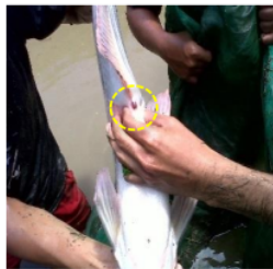
Gambar 4. Striping induk jantan

Calon induk ikan patin jantan yang akan dipijahkan adalah ikan yang memiliki ciri pada alat kelamin (urogenital) sudah membengkak dan berwarna merah tua. Apabila dilakukan pengurutan ke arah urogenital keluar cairan sperma kental, berwarna putih dan tidak mengandung darah.