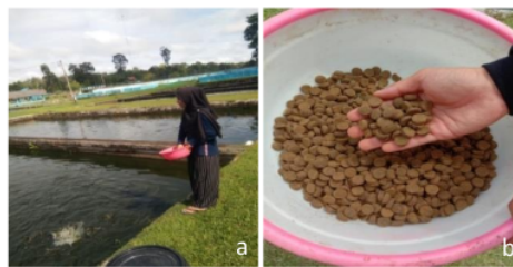
Gambar 2. a) Pemberian pakan b) Pakan

Metode pemberian pakan dilakukan secara manual atau handfeeding dengan pada feeding site satu titik. Pemberian pakan disesuaikan dengan kondisi cuaca, apabila hujan maka pemberian pakan tidak dilakukan. Secara teknis, pemberian pakan dilakukan sebanyak 2 kali sehari yaitu pada pukul 08.00 dan pukul 16.00 dengan tingkat pemberian pakan 1% dari biomassa ikan (Gambar 2).