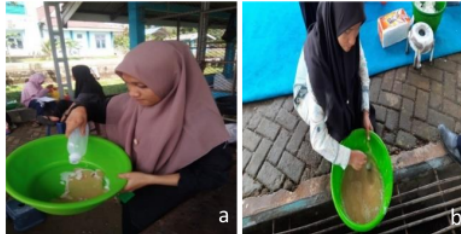
Gambar 6 a) Pencampuran telur dan sperma dengan larutan NaCl, b) Penambahan air pada campuran telur dan sperma

menit, lalu air dibuang sebagian dan dilanjutkan dengan penambahan tanah liat yang bertujuan untuk menghilangkan daya rekat telur.