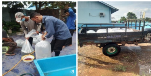
Gambar 9 a) Proses pengemasan benih, b) Transportasi benih

Benih hasil sortasi selanjutnya akan didistribusikan kepada konsumen. Benih dikemas menggunakan plastik packing ukuran 60 x 100 cm (Gambar 9). Plastik packing yang digunakan sebanyak 2 lapis dan diikat pada bagian sudutnya menggunakan karet untuk menghilangkan sudut mati pada plastik. Perbandingan antara volume air dan oksigen di dalam kantong 1:3. Kepadatan benih ukuran 1,5-2,5 inchi yang akan dikirim ke lokasi konsumen dengan jarak jauh (lebih dari 10-12 jam perjalanan) sebanyak 500 ekor/kantong dan untuk perjalanan jarak dekat sebanyak 750 ekor/kantong, sedangkan kepadatan benih ukuran \geq 2,5 inchi untuk perjalanan jarak jauh sebanyak 250- 300 ekor/kantong dan untuk perjalanan jarak dekat sebanyak 500 ekor/kantong.