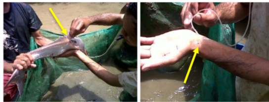
Gambar 3 Kanulasi induk betina menggunakan kateter

Tahapan seleksi berdasarkan hasil pengamatan secara visual pada morfologi ikan, melalui warna dan perkembangan diameter telur. Calon induk ikan betina yang akan dipijahkan adalah induk yang pada bagian perutnya sudah terlihat membesar, apabila diraba akan terasa lembek, dan pada lubang urogenital terlihat berwarna merah. Untuk mengamati kondisi telur, diambil sampel telur ikan dengan cara kanulasi menggunakan selang kateter. Selang kateter dimasukkan ke dalam lubang urogenital ikan patin siam betina secara perlahan hingga menyentuh telur, kemudian selang kateter dihisap, ditahan hingga terbawa beberapa telur pada selang kateter. Telur yang terdapat pada selang kateter dioleskan ke tangan dan diamati. Telur yang bagus adalah telur yang tidak bercampur dengan darah, ukuran sudah terlihat seragam, berwarna bening, dan berdiameter 0,9-1 mm. Perkembangan diameter telur yang diambil dan diukur digunakan sebagai indikator kematangan seksual.