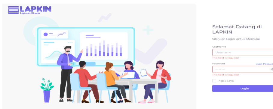
Gambar 1. 1 Tampilan Login Aplikasi e-Lapkin