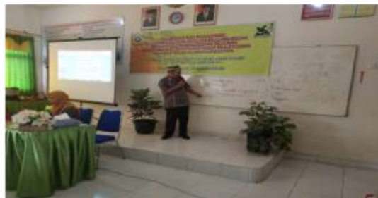
Gambar 2 Penjelasan Materi oleh Narasumber mengenai PTK