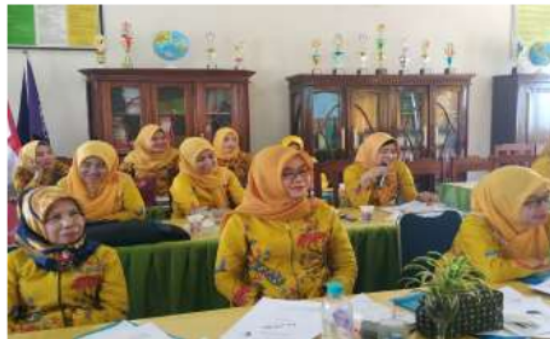
Gambar 1 Peserta Pelatihan

Pelaksanaan pembinaan dan pelatihan ini dalam waktu 7 (tujuh) bulan terhitung dari mulai disusunnya proposal kegiatan Pengabdian kepada Masyarakat. Pada tahun 2019 ini fokus mengkaji mengenai PTK dan LKPD yang dilaksanakan dalam suatu tindakan pembinaan dan pelatihan. Kegiatan Pengabdian ini dilaksanakan di SDN 68 Palembang sebagai sekolah mitra PGSD FKIP Universitas Sriwijaya. Kegiatan tatap muka dilaksanakan pada 20 – 21 September 2019, yang diikuti oleh 20 orang guru. Berikut gambar peserta pelatihan.