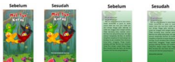
Gambar 4 Tampilan Produk Sebelum dan Setelah Direvisi

Revisi dilakukan untuk memperbaiki produk yang telah dikembangkan dan dinilai oleh ahli pada tahap sebelumnya. Revisi dilakukan dengan berlandas pada saran ahli. Berikut spesimen tampilan produk yang telah direvisi berdasarkan saran dari validator, yaitu menambahkan identitas penulis dan sumber cerita.