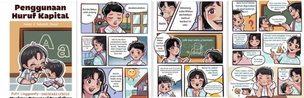
Gambar 3. Setelah perbaikan

Perbaikan desain dilakukan setelah mendapatkan penilaian dari ahli media, ahli materi, dan ahli bahasa dengan melihat hasil validasi yang diberikan. Revisi produk dilakukan dengan tujuan untuk mendapatkan kelayakan dalam media yang dikembangkan.