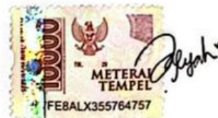
Afifah Nur Fitriyah