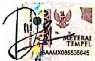
Desi Ana Anggraini