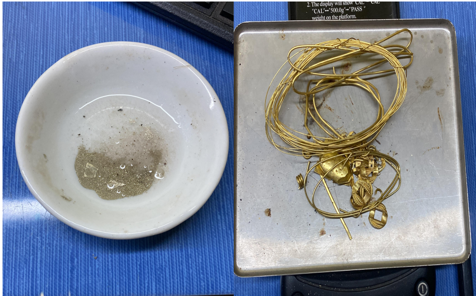
Gambar 1.1 Sisa Pengerjaan Pandai Emas